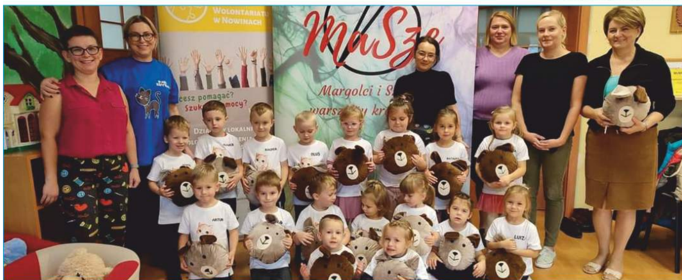
Przedszkolaki z Przedszkola Samorządowego im. Pluszowego Misia w Nowinach uszyły ponad 50 poduszek