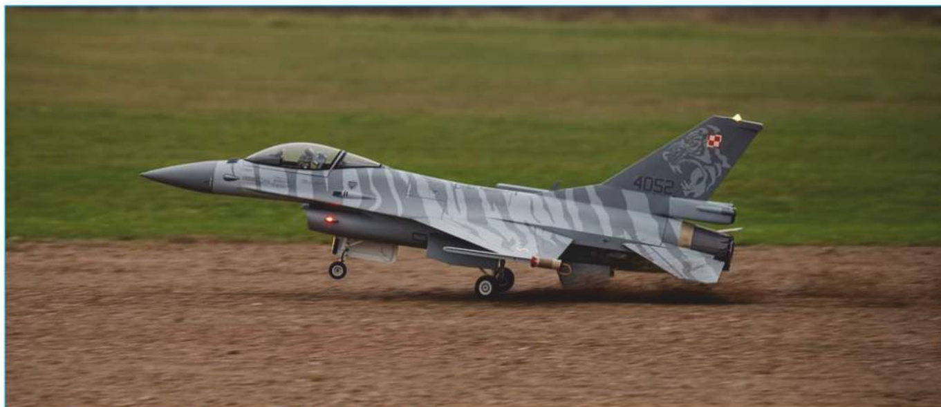
Prezentacja modeli samolotów przez Kielecki Klub Modelarski