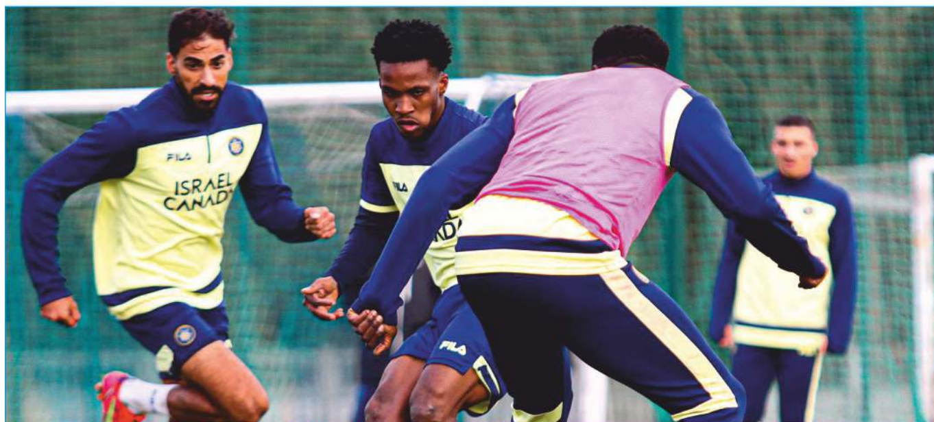
Maccabi Tel-Awiw trenuje na stadionie w Nowinach