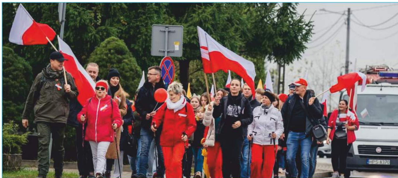
Marsz na Kowalę 2023!