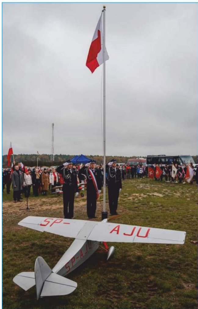
Druhowie i Druhny jednostek OSP z gminy Nowiny