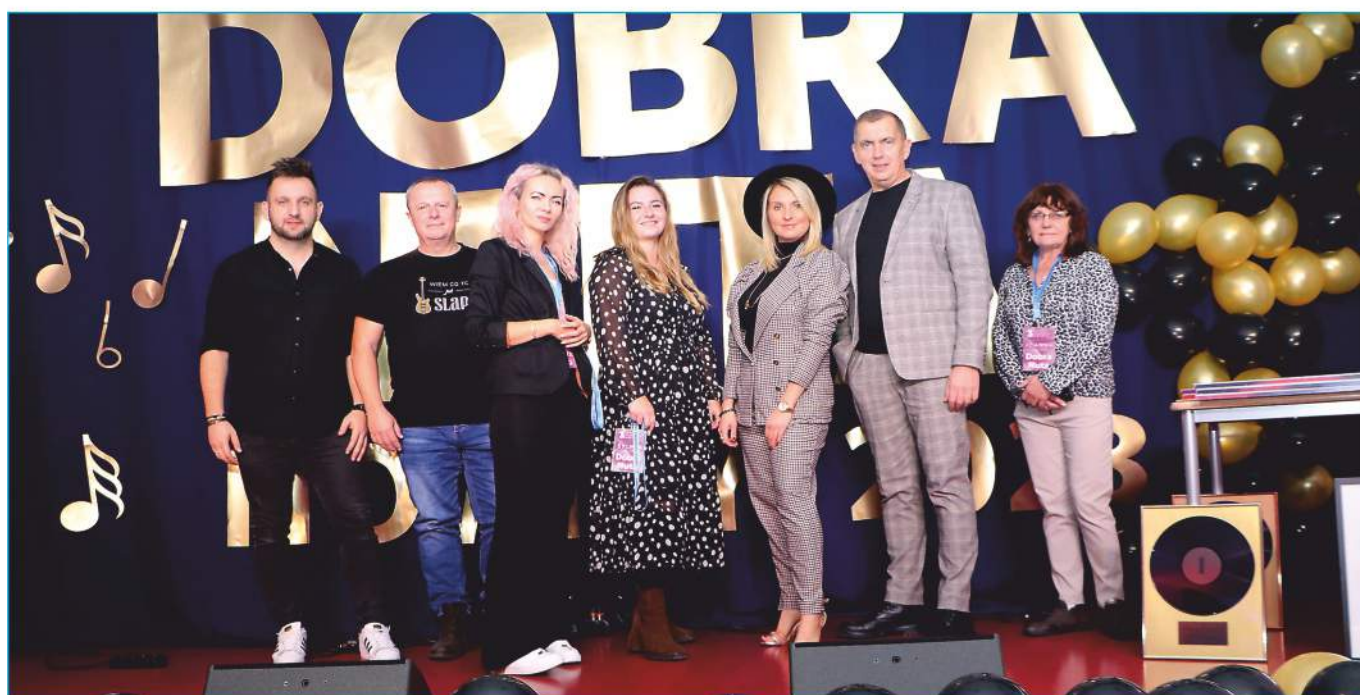
Jury i Organizatorzy Festiwalu