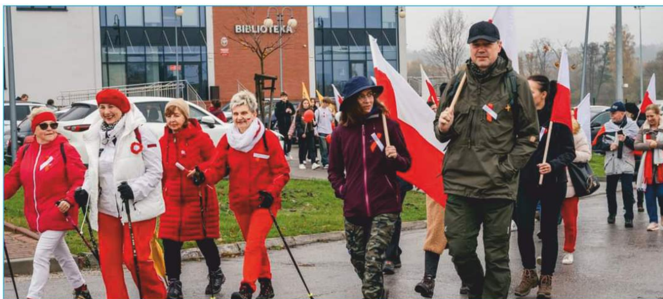
Marsz na Kowalę 2023!