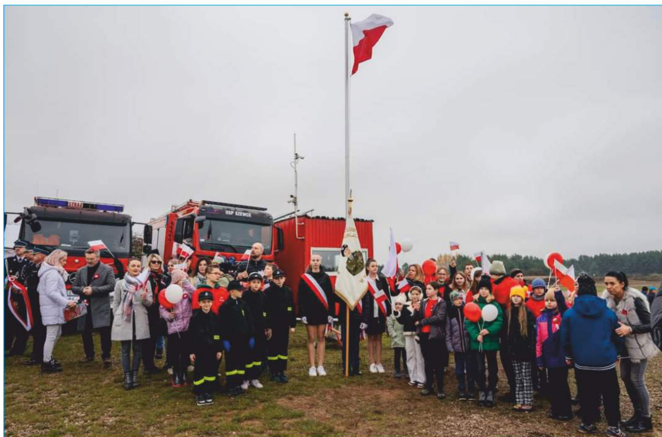
Poczty sztandarowe szkół i straży pożarnych