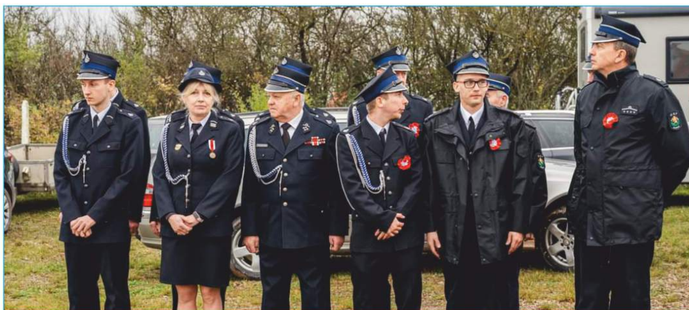
Druhowie i Druhny jednostek OSP z gminy Nowiny