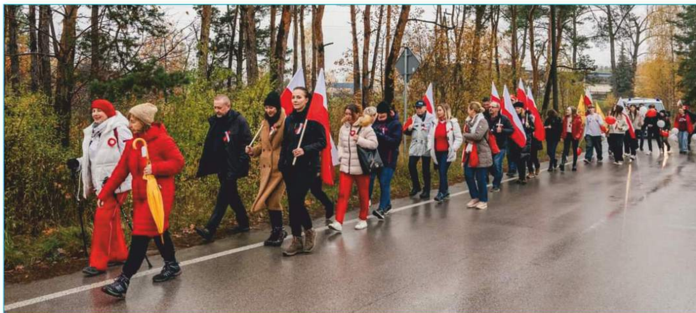
Marsz na Kowalę 2023!