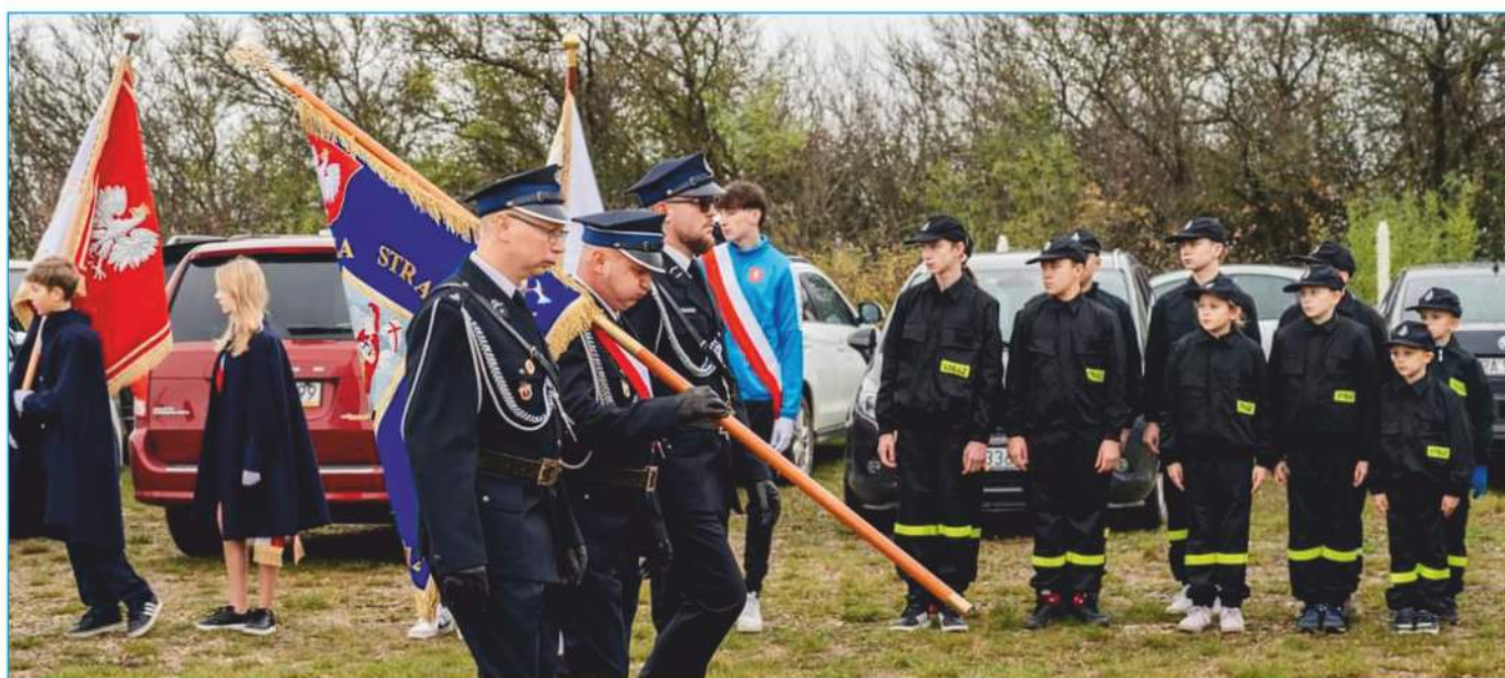
Druhowie i Druhny jednostek OSP z gminy Nowiny