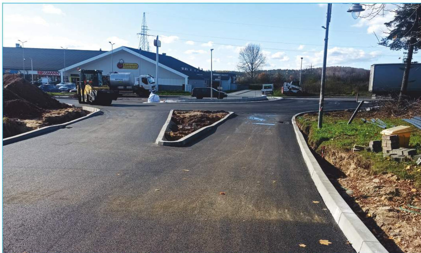
Rozbudowa skrzyżowania drogi powiatowej nr 1366T ul. Przemysłowa z drogą gminną ul. Białe Zagłębie w Nowinach