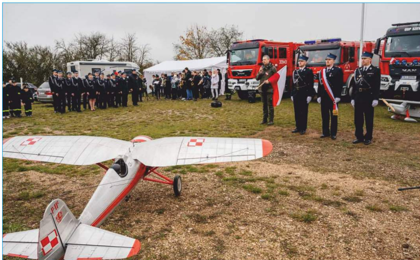
Druhowie i Druhny jednostek OSP z gminy Nowiny