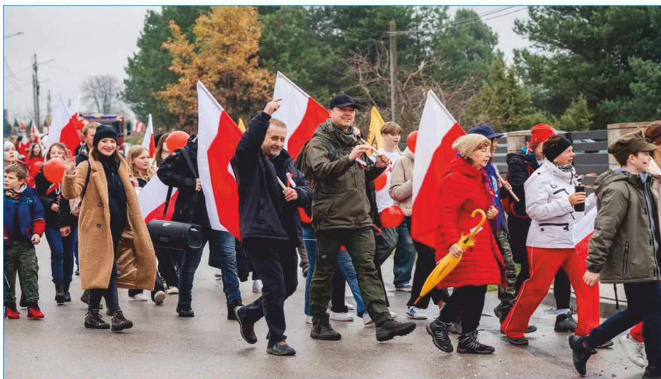
Mieszkańcy licznie uczestniczyli w Biało-Czerwonym Marszu na Kowale!