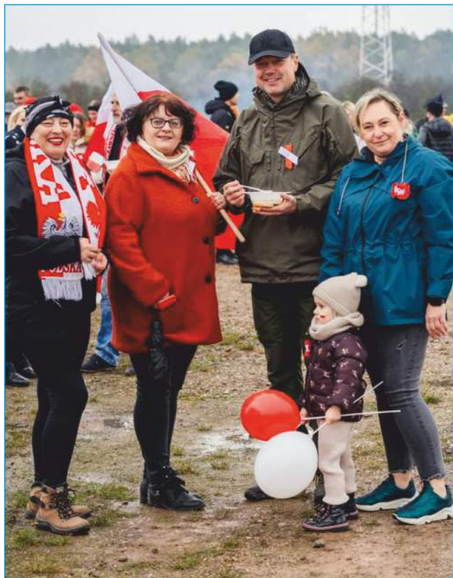
Marsz na Kowalę 2023!

Historia świętowania Niepodległości w gminie Nowiny zatoczyła koło. Po raz drugi gościliśmy na Lotnisku Modelarskim w Kowali, by wspólnie przeżywać podniosłe chwile w duchu patriotyzmu i wdzięczności za Niepodległą Polskę.