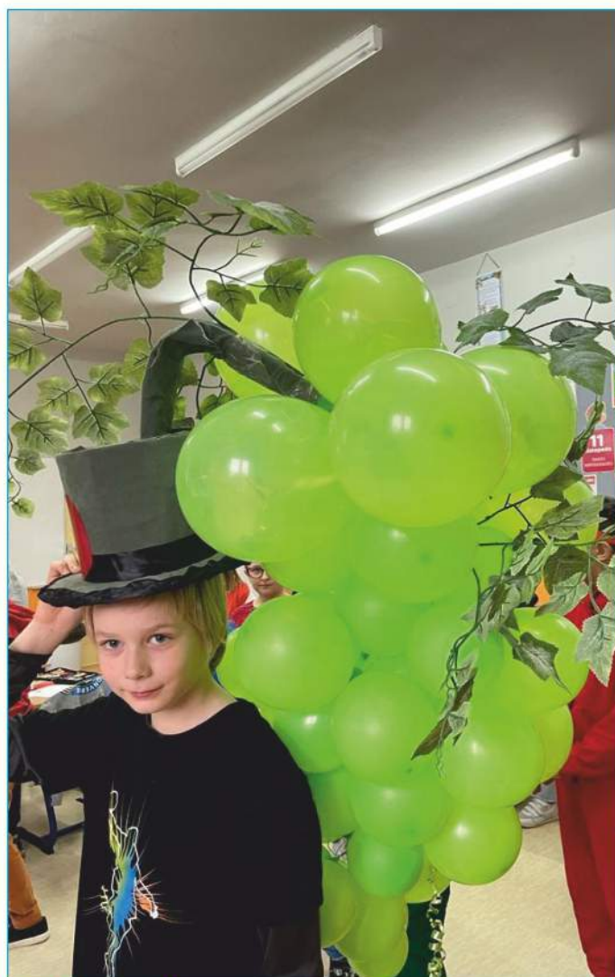
Dzień Owoców i Warzyw

W ramach projektu w szkole prowadzone zostały zajęcia pt. „Nie takie straszne jak nas widzą - niegroźne, a nawet pożyteczne zwierzęta i rośliny”. Uczniowie z zainteresowaniem, skupieniem słuchali różnych ciekawostek oraz oglądali zdjęcia i filmy