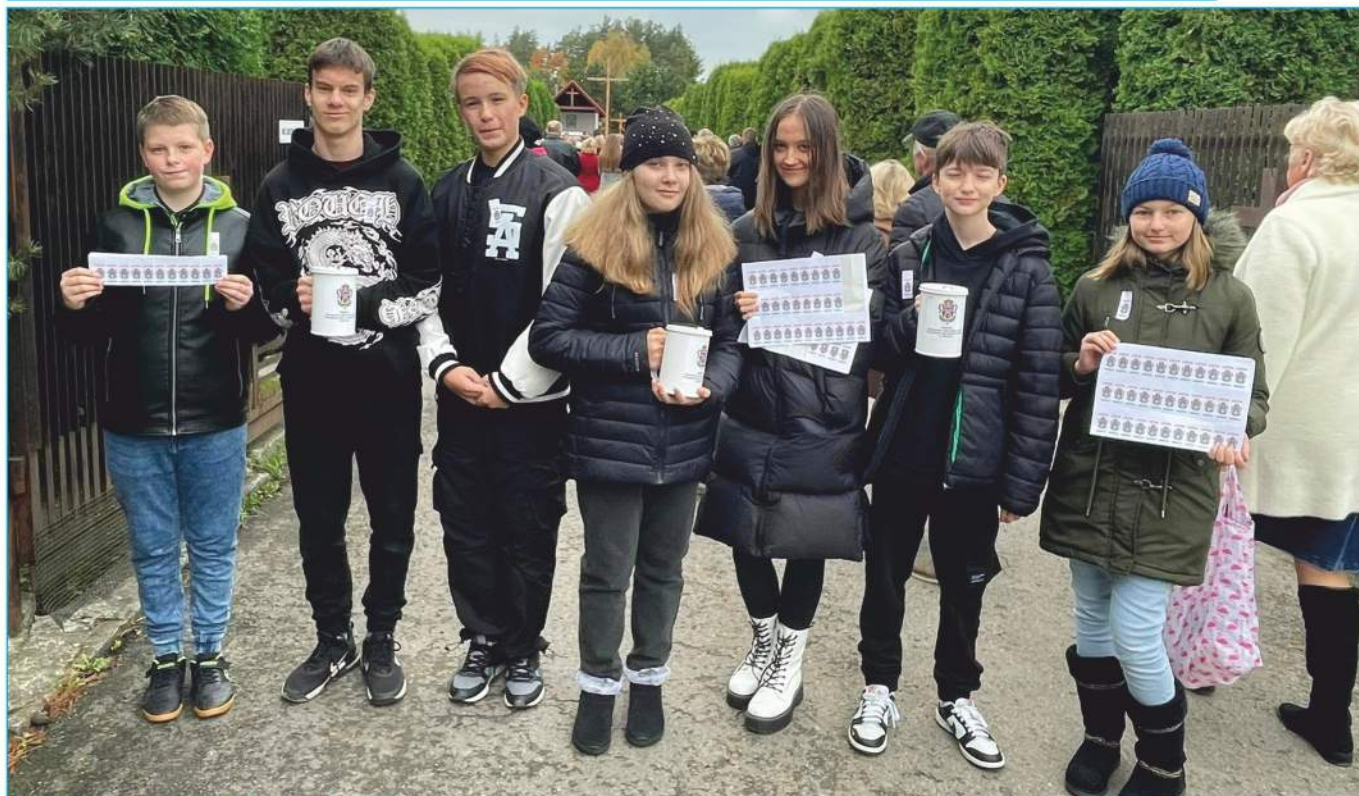
Kwesta na pomoc rodakom na Kresach

Listopad w Szkole Podstawowej im. Orłąt Lwowskich w Nowinach obfitował w wiele aktywności podejmowanych ponad szkolną podstawę programową. Szkoła włączyła się w ogólnopolską zbiórkę pieniędzy pn. „Kwesta na pomoc rodakom na Kresach”. Zebrane pieniądze wspomogą Polaków mieszkających na Kresach oraz zostaną przeznaczone na odnowienie mogił na Cmentarzu Orłąt Lwowskich. W dniach 30-31 października uczniowie kwestowali w szkole, a 1 listopada na cmentarzu w Nowinach.