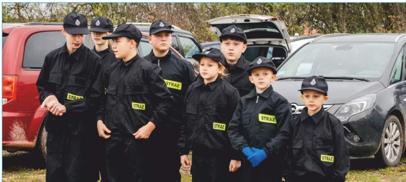
Druhowie i Druhny jednostek OSP z gminy Nowiny