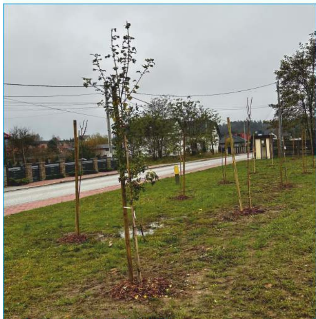
Nasadenia klonu i głogu w Kowali

Wieloletnia ekspansja człowieka nie pozostaje bez wpływu na stan środowiska naturalnego. Od lat ekolodzy alarmują, że pszczoły masowo giną, co niestety może mieć straszne skutki dla produkcji żywności na całym świecie. To te niepozorne owady są odpowiedzialne za ponad 70 % zapyleń, dzięki