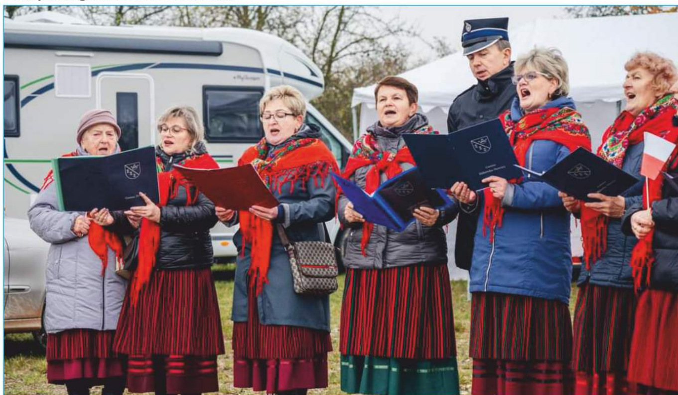
Prezentacja artystyczna KGW „Kowalanki”