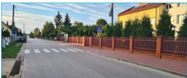
Przeście dla pieszych w Bolechowicach

Takie nowiny bardzo lubimy. Kolejne dofinansowanie dla gminy Nowiny. Wspólny wniosek gminy Nowiny i Powiatu Kieleckiego w ramach Funduszu Rozwoju Dróg, otrzymał dofinansowanie na przebudowę przejścia dla