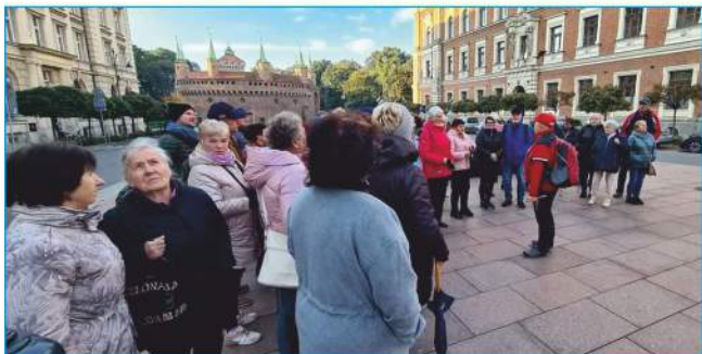
Seniorki i Seniorzy z naszej gminy na wycieczce w Krakowie

20 października świętowaliśmy Europejski Dzień Seniora. - Składam najlepsze życzenia dla seniorów i osób starszych z gminy Nowiny. Mieliśmy przyjemność wspólnie zwiedzać Kraków z grupą