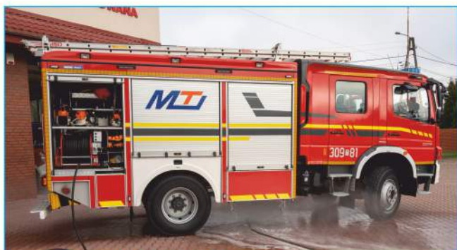
Lanca gaśnicza dla OSP Wola Murowana

OSP Wola Murowana pozyskała z firmy MIST-TECH Lancę gaśniczą EV. Jest to specjalnie zaprojektowane urządzenie, które umożliwia służbom skuteczne i bezpieczne podjęcie działań związanych z pożarem samochodów wyposażonych w napęd elektryczny. Urządzenie umieszcza się pod podwoziem palącego się samochodu. Konstrukcja lancy jest zoptymalizowana pod kątem efektywnego rozpylania środka gaśniczego. Jednostka pozyskała sprzęt dzięki wsparciu finansowemu firmy Lafarge Kruszywa i Beton Sp. z o.o. Ochotnicza Straż Pożarna Wola Murowana jest jedną z pierwszych OSP w województwie, które dysponuje taką lancą.