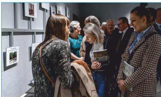
Mieszkańcy i goście po raz pierwszy zwiedzają „Miniaturę Historii”