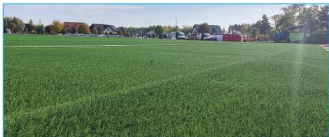
Budowa boiska treningowego w Nowinach

Dobiega końca budowa boiska treningowego w Nowinach. Nawierzchnia została utwardzona i pokryta trawą.