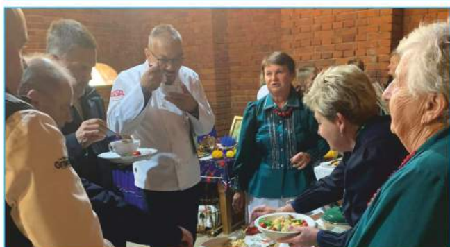
II miejsce dla „Kowalanek”

KGW Kowalanek zajęło II miejsce w Konkursie na najsmaczniejszą potrawę z gęsiny organizowaną podczas wydarzenia Smaki Gęsiny w Tokarni.