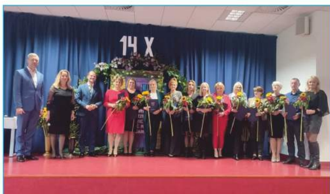
Nagrodzeni Dyrektorzy, Nauczyciele, Pracownicy Oświaty i Obsługi