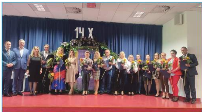
Nagrodzeni Dyrektorzy, Nauczyciele, Pracownicy Oświaty i Obsługi