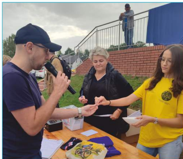
Wolontariusze LCW w Nowinach

Na rozpoczęcie roku szkolnego wolontariusze przygotowali także wyprawki szkolne, które trafiły do najbardziej potrzebujących dzieci w naszej gminie.