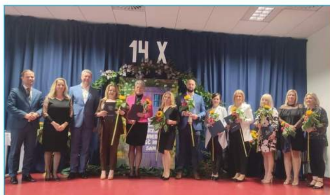
Nagrodzeni Dyrektorzy, Nauczyciele, Pracownicy Oświaty i Obsługi