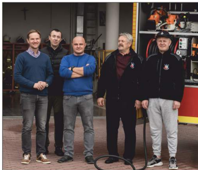
Przekazanie lancy gaśniczej OSP Wola Murowana