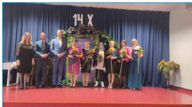
Nagrodzeni Dyrektorzy, Nauczyciele, Pracownicy Oświaty i Obsługi