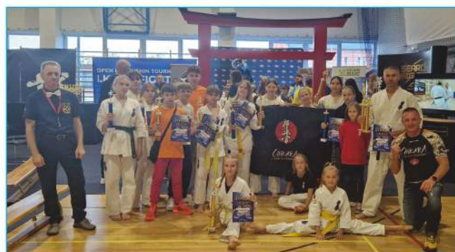
IKON w Białymstoku