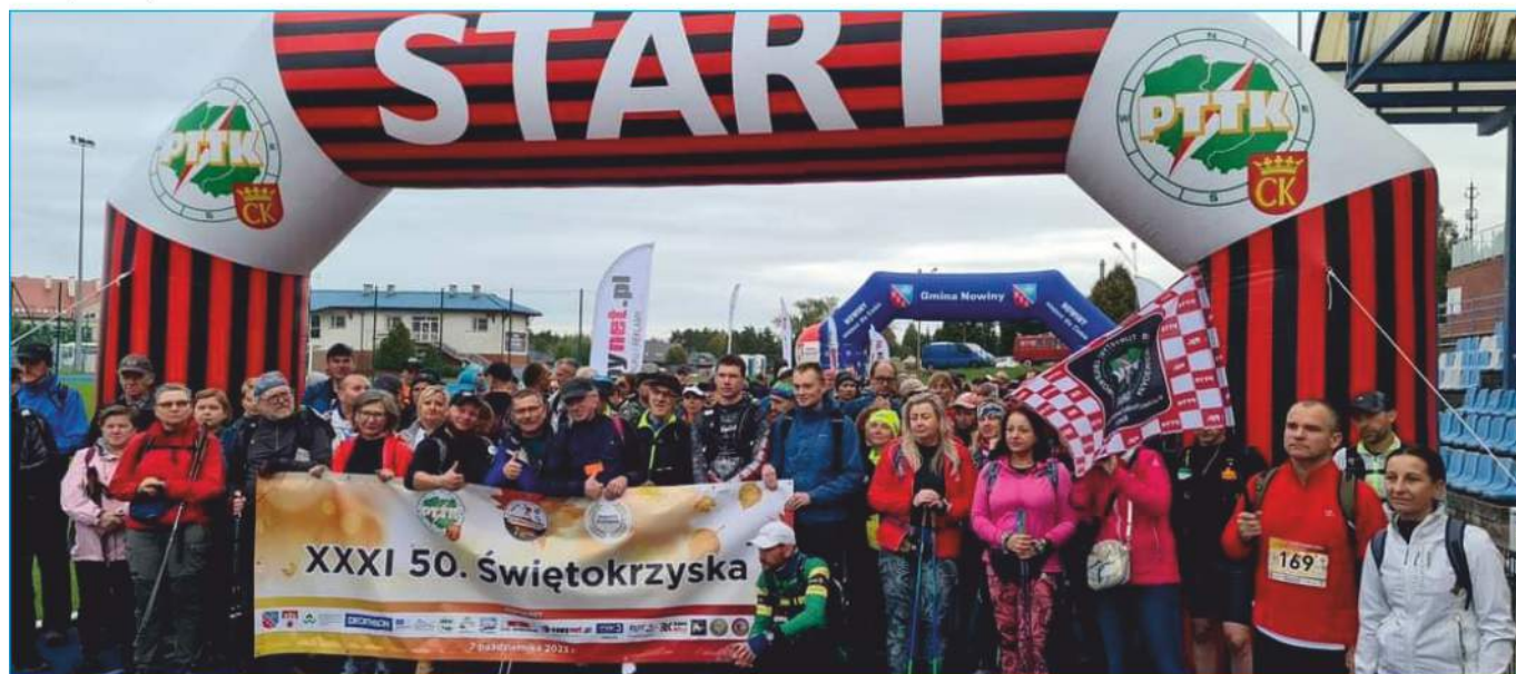
Start i meta maratonu miały miejsce na Stadionie w Nowinach

W sobotę 7 października ze stadionu w Nowinach wystartował XXXI Maraton Pieszy 50. Świętokrzyska. To najstarsza długodystansowa impreza piesza w Górach Świętokrzyskich. Od ponad 30 lat wczesnojesienną porą ponad 200 piechurów i biegaczy z całej Polski przemierza coraz to nowe zakątki naszych pięknych Gór Świętokrzyskich.