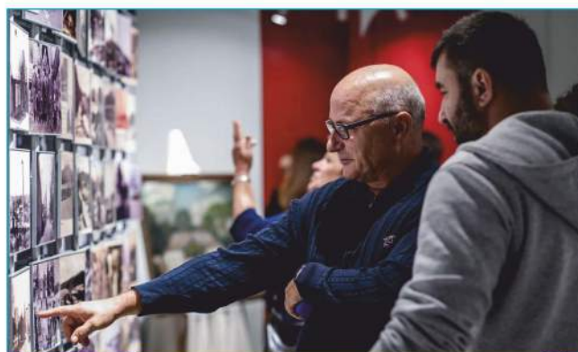
Mieszkańcy odkrywają na wystawie znajome miejsca z przeszłości. Wspomnienia powracają ...