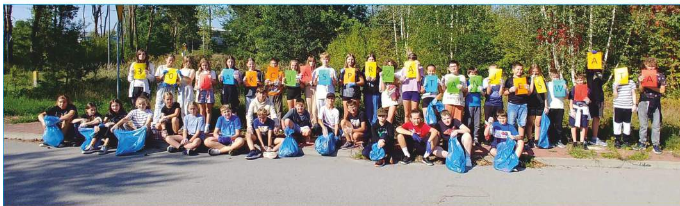
Szkoła Podstawowa w Nowinach włączyła się w akcję „Sprzątanie świata”

To wspólna lekcja poszanowania środowiska. W tym roku w Polsce odbywa się już 30 raz. Dołączyli do niej również uczniowie klasy 5b i 6b Szkoły Podstawowej w Nowinach. Sprzątali teren gminy Nowiny w okolicach Trzcianek. Zebrali 27 worków odpadów - głównie szklanych butelek i plastikowych opakowań. Oni już wiedzą, ile wysiłku kosztuje zebranie zalegających wokół śmieci i na pewno szybko nie wyrzucą butelki po napoju czy opakowania po chrupkach na trawnik. A Ty? Niech każdy posprząta kawałek, a wszyscy razem posprzątamy całą Polskę.