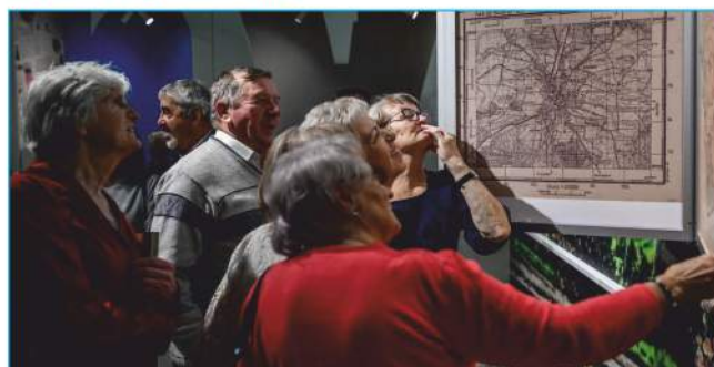
Mieszkańcy odkrywają na wystawie znajome miejsca z przeszłości. Wspomnienia powracają ...