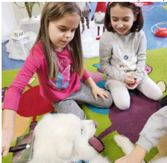
Psia lekcja w Bolechowicach