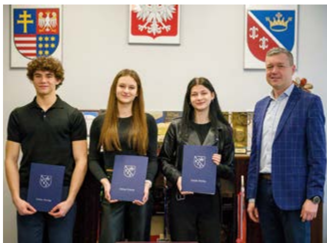
Stypendia sportowe wójta gminy Nowiny