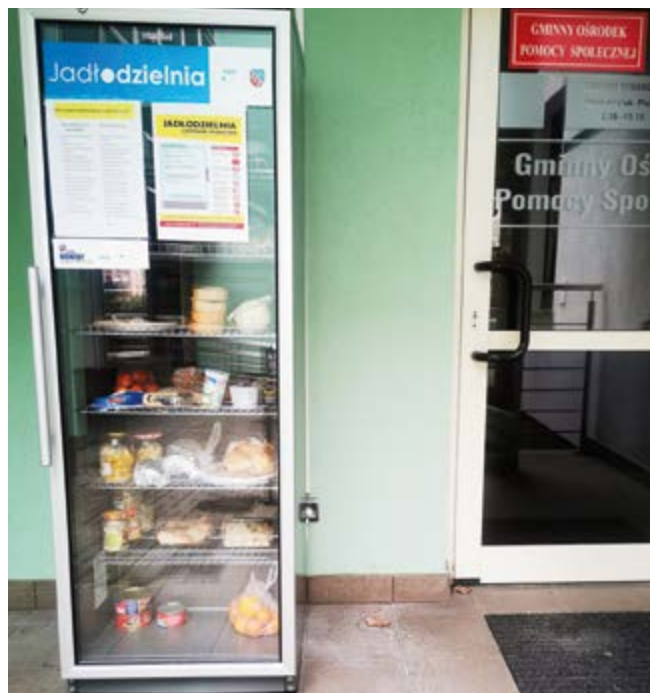
Jadłodzielnia w Nowinach

Przypominamy naszym mieszkańcom, że cały czas funkcjonuje Jadłodzielnia w Nowinach. Lodówka społeczna znajduje się przy budynku Urzędu Gminy Nowiny. Można tam umieścić żywność która, nie jest przeterminowana, nadaje się do spożycia, którą chcecie się Państwo podzielić z potrzebującymi. Powyższe działanie ma na celu zapobieganie marnotrawieniu żywności oraz wsparcie osób potrzebujących.