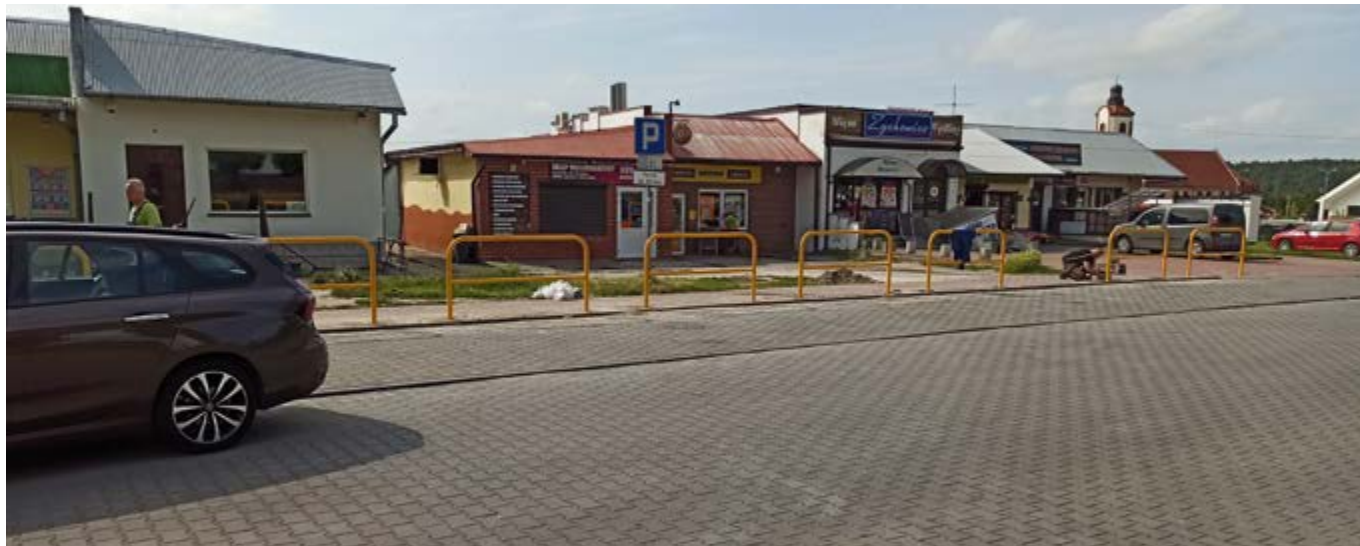
Przebudowa zatoki postojowej ul. Białe Zagłębie w Nowinach