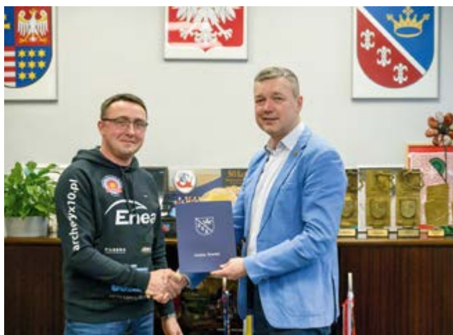
Stypendia sportowe wójta gminy Nowiny