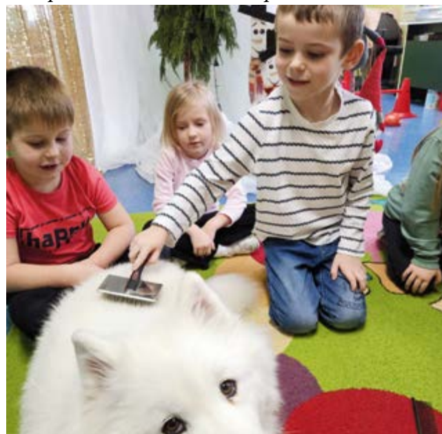
Psia lekcja w Bolechowicach