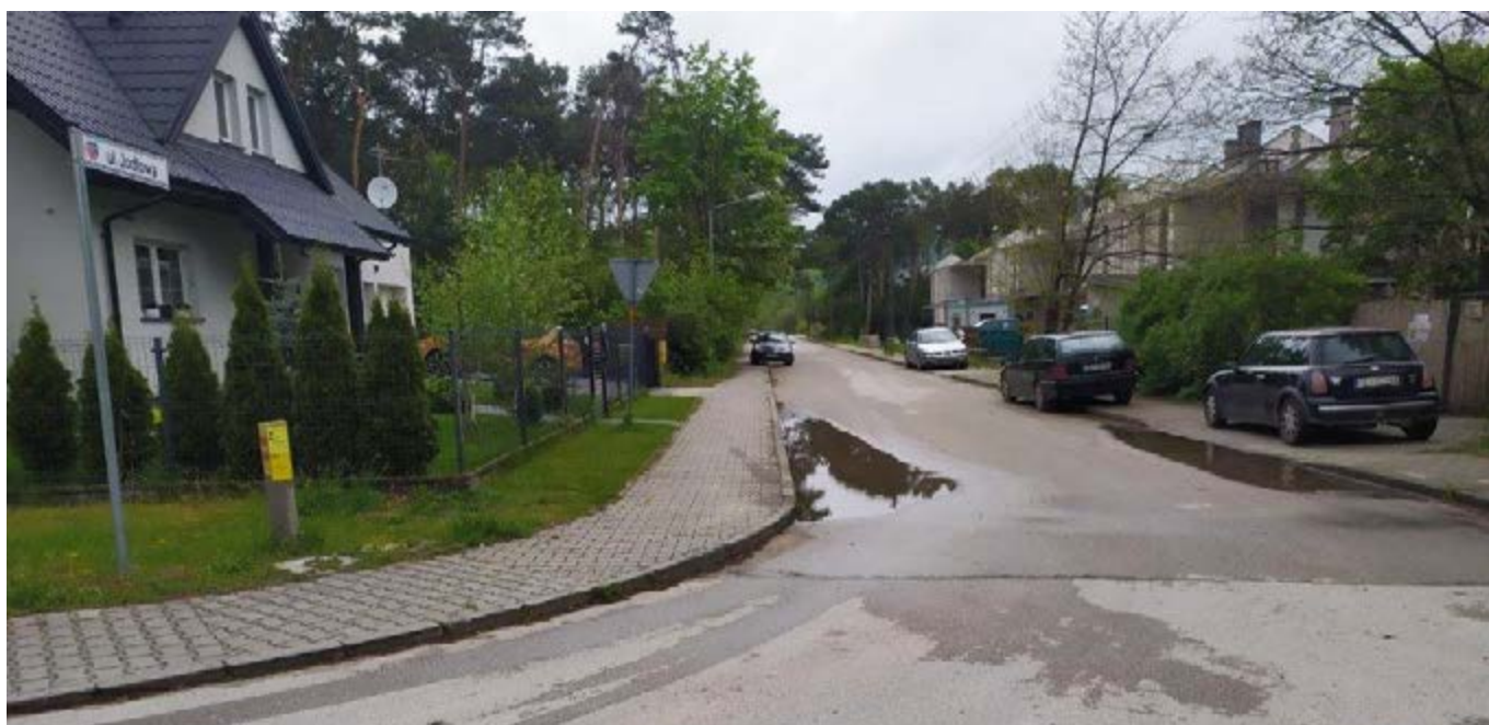
Trzcianki, ulica Jodłowa