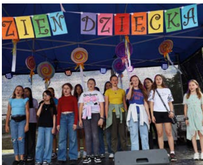
Prezentacje artystyczne młodzieży szkolnej