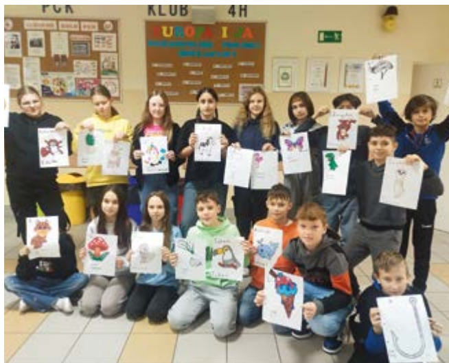
Projekt edukacyjny "Europa i ja"

Klasy wraz z wychowawcami wybrały następujące kraje: 4a- Chorwacja, 4b- Słowacja, 4c- Niemcy, 5b- Norwegia, 5c- Dania, 6a- Słowenia, 6b- Włochy, 6c- Hiszpania, 7c- Grecja, 8b- Holandia.