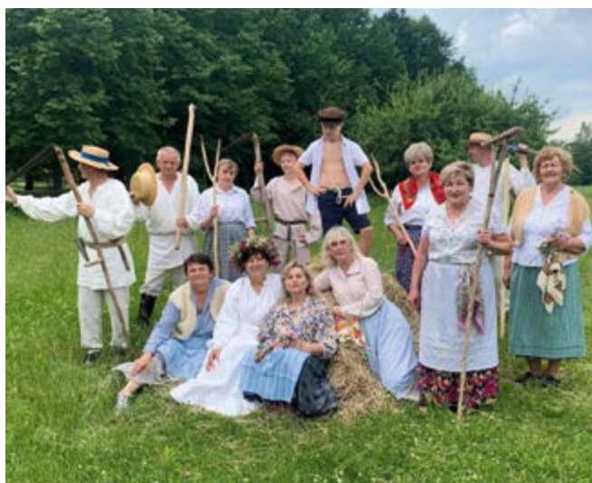
Obrzęd „Wyzwoliny kosiarza”

Zespoły reprezentujące naszą gminę: KGW Kowalanki i „Bolechowiczanie” 9 czerwca wzięły udział w „Rodzinnej niedzieli w skansenie”. To cykliczne wydarzenie organizowane na terenie Muzeum Wsi Kieleckiej w Tokarni. Zespół obrzędowy „Kowalanki” zaprezentował obrzęd „Wyzwoliny kosiarza”, a „Bolechowiczanie” zapraszali gości do wspólnej zabawy.