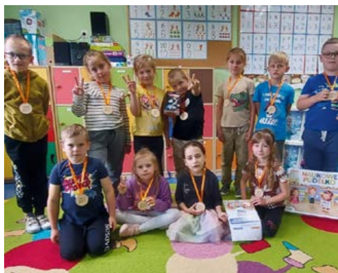
Program "Mali Wielcy Odkrywcy" w Bolechowicach

W roku szkolnym 2023/2024 dzieci z grupy „Żabki” z Przedszkola Samorządowego w Bolechowicach realizowały Ogólnopolski program oświatowy „Mali Wielcy Odkrywcy” pod patronem Ministerstwa Edukacji i Nauki oraz Fundacji PGNiG im. Ignacego Łukasiewicza. Głównym celem programu było propagowanie edukacji przez zachęcanie najmłodszych do przeprowadzania doświadczeń. Program wzbudził zainteresowanie dzieci nauką i rozbudził w nich chęci do poznawania otaczającego je świata. Zajęcia były pełne eksperymentów, doświadczeń i praktycznych obserwacji. W tej edycji programu braliśmy udział w 3 etapach zajęć dotyczących: