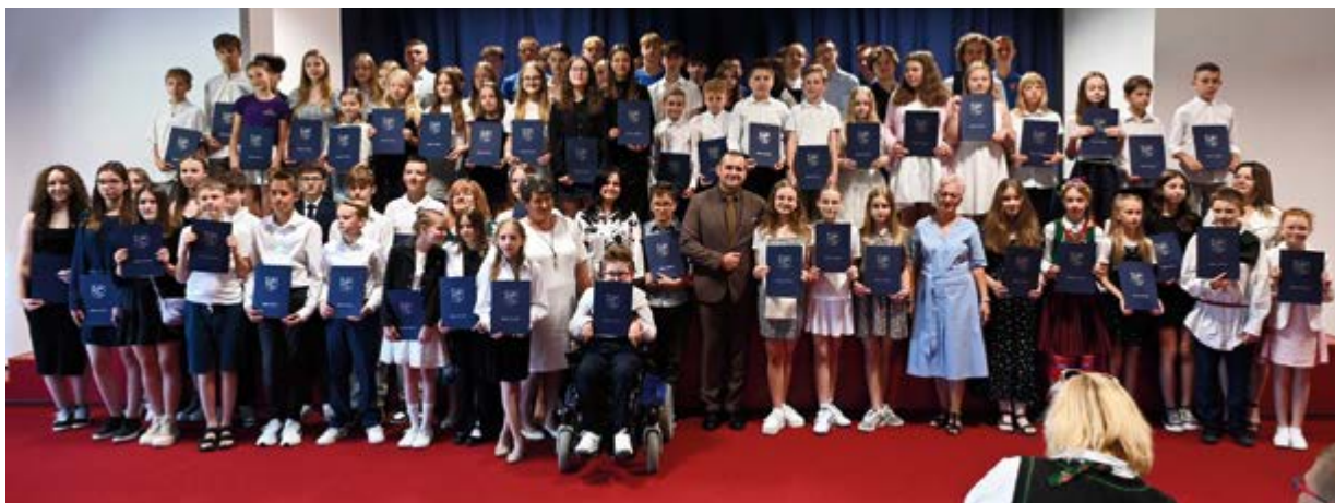
Stypendyści nagród Wójta Gminy Nowiny