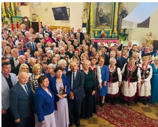
Wykonawcy Koncertu w Brzezinach