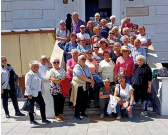
Wizyty studyjne seniorów