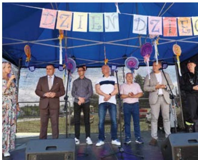
Życzenia dzieciom złożyli wójt i rada gminy

i zainteresowaniem dzieci cieszyły się liczne strefy warsztatowe, kiermasze, stoiska tematyczne, zajęcia, zabawy i animacje dla najmłodszych.