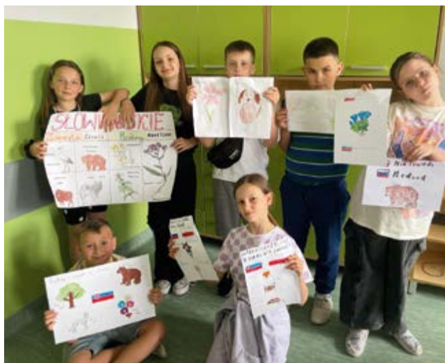
Projekt edukacyjny "Europa i ja"

poznać symbole narodowe wybranego kraju, nauczyć się liczyć w wybranym przez siebie języku, a także wykonali słowniki obrazkowe. Ponadto poznali roślinność i zwierzęta danego państwa, sławnych Europejczyków, ciekawe miejsca, który warto zobaczyć. Była to ciekawa i bardzo pouczająca przygoda.