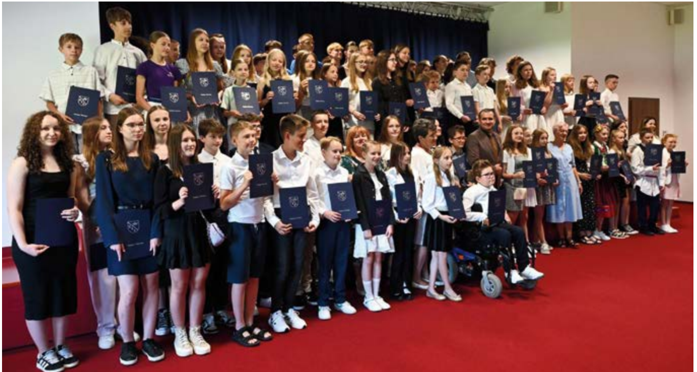
Stypendyści nagród Wójta Gminy Nowiny