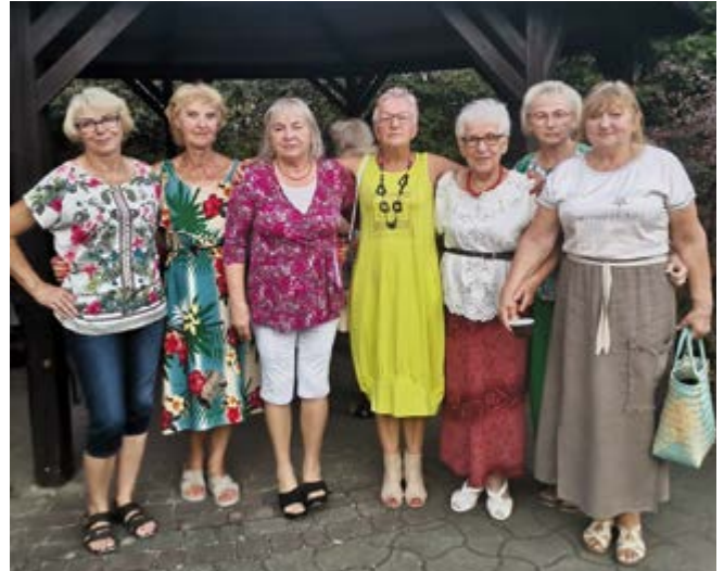
Spotkania integracyjne seniorów budują relacje

W chwili obecnej nasz klub liczy 60 osób, są to emeryci naszej gminy, często osoby samotne. To grupa ludzi o podobnej wrażliwości i zainteresowaniach. W czasie spotkań wymieniamy swoje doświadczenia, nabyte w czasie pracy zawodowej jak również mądrości życiowe. Bardzo aktywnie współpracujemy ze stowarzyszeniem „Kocham Świętokrzyskie”, z zespołami śpiewaczymi gminy i OSP. Wspólnie promujemy naszą tradycyjną kulturę, bierzemy udział w różnych uroczystościach i wydarzeniach. Przystępujemy do konkursów, składając oferty konkursowe, celem pozyskania środków na naszą działalność i dzięki Urzędowi Marszałkowskiemu Województwa Świętokrzyskiego i niewielkim składkom rocznym