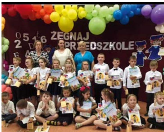
Przedszkole w Nowinach