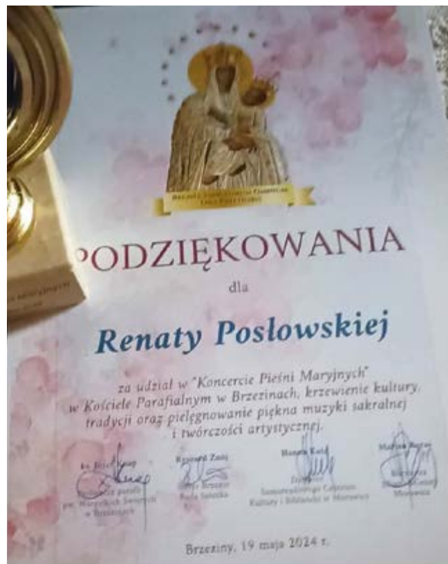
Dyplom Renaty Posłowskiej