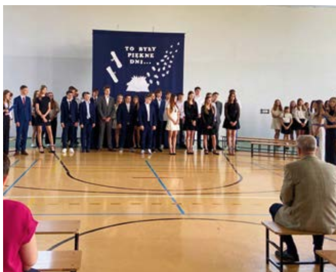
Szkoła Podstawowa w Nowinach