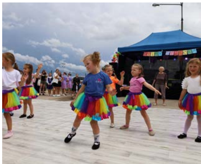
Prezentacje artystyczne dzieci