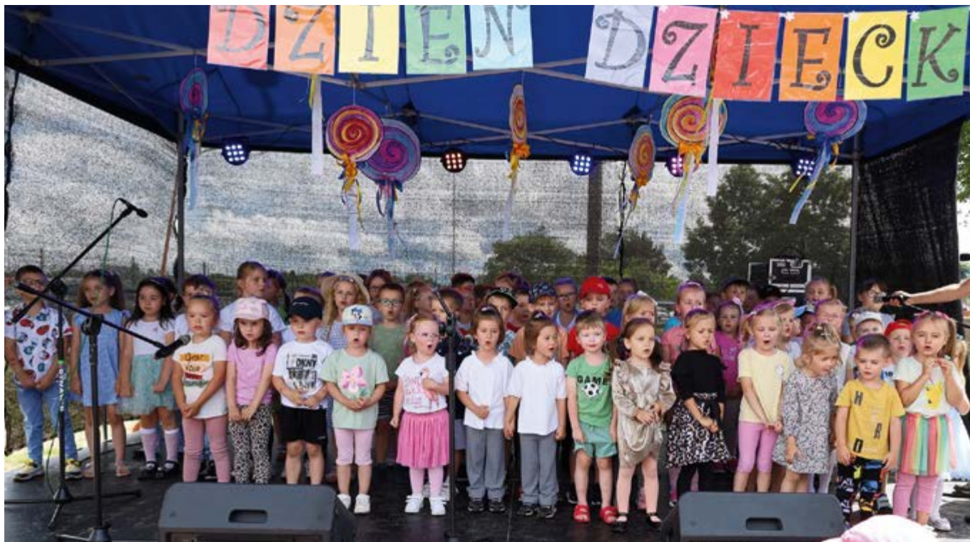
Wielkie święto dzieci w Nowinach