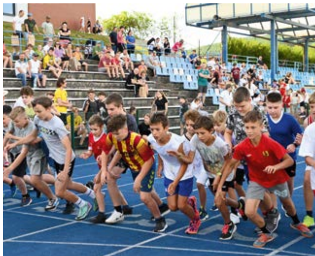
Start Biegu Chłopców