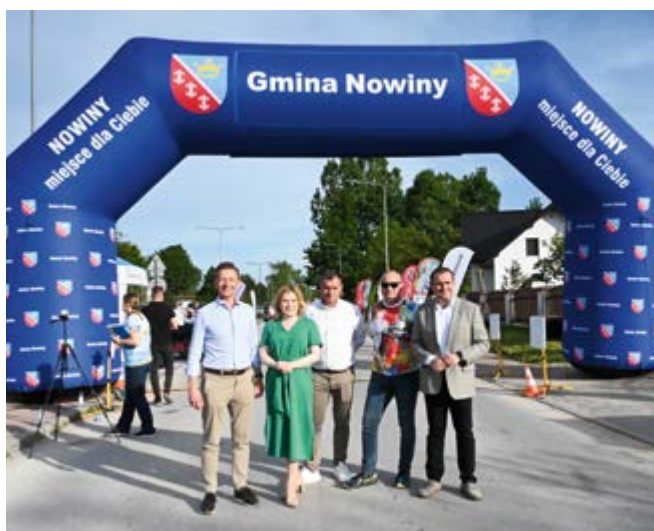
Na mecie na biegaczy czekali goście honorowi