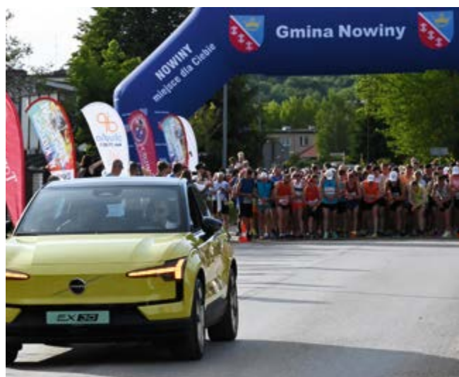
Volvo Pro-Mot Kielce, sponsor Biegu