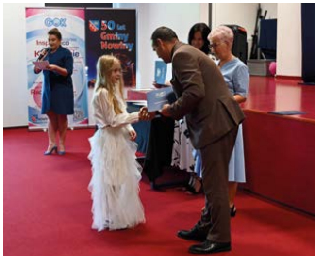
Uroczystość wręczenia stypendiów Wójta Gminy Nowiny