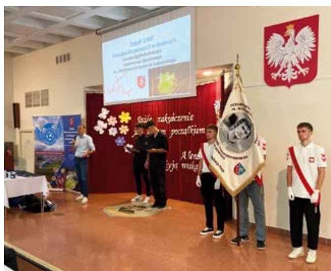
Zespół Szkół Ponadpodstawowych w Nowinach