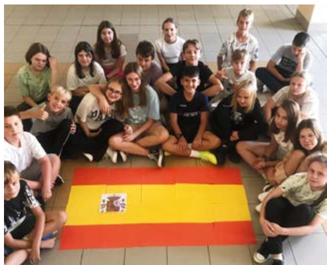
Projekt edukacyjny "Europa i ja"

Projekt był realizowany od października 2023 r. do maja 2024 r. W tym czasie uczniowie mieli okazję