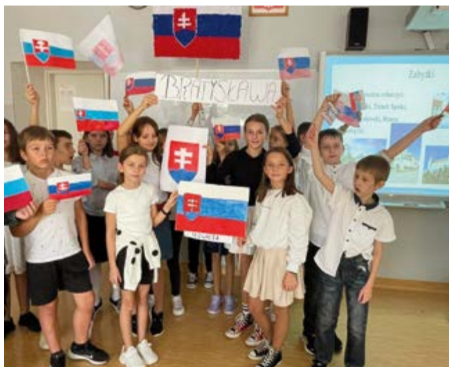
Projekt edukacyjny "Europa i ja"

poznać symbole narodowe wybranego kraju, nauczyć się liczyć w wybranym przez siebie języku, a także wykonali słowniki obrazkowe. Ponadto poznali roślinność i zwierzęta danego państwa, sławnych Europejczyków, ciekawe miejsca, który warto zobaczyć. Była to ciekawa i bardzo pouczająca przygoda.