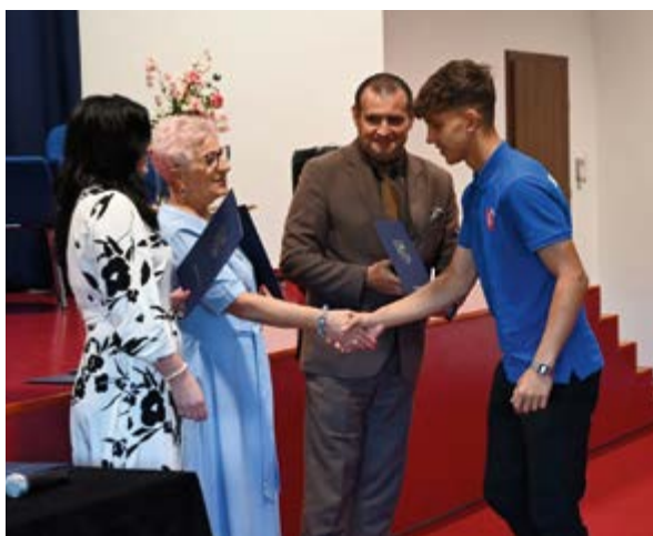
Uroczystość wręczenia stypendiów naukowych i sportowych