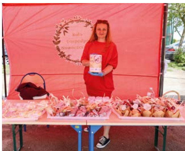
Strefa Koła Gospodyń Nowoczesnych