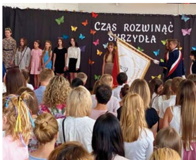
Zespół Placówek Oświatowych w Bolechowicach