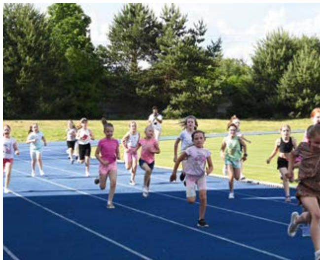
Rywalizacja w duchu fair play