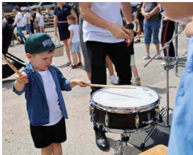
Rekrutacja do Orkiestry Dętej w Nowinach