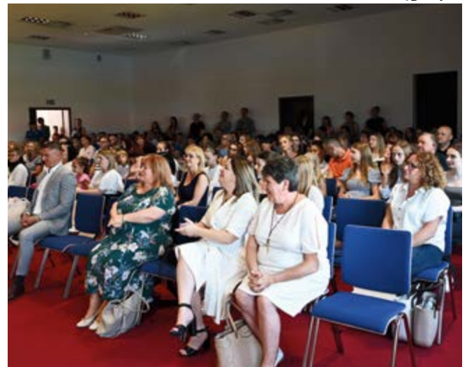
Dorośli podziwiali sukcesy naukowe i sportowe uczniów