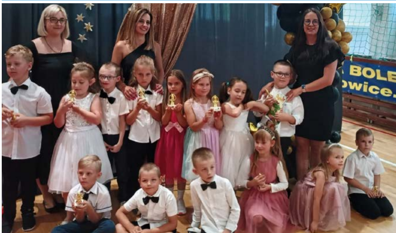
Uroczyste pożegnanie Przedszkolaków 6-latków w Bolechowicach