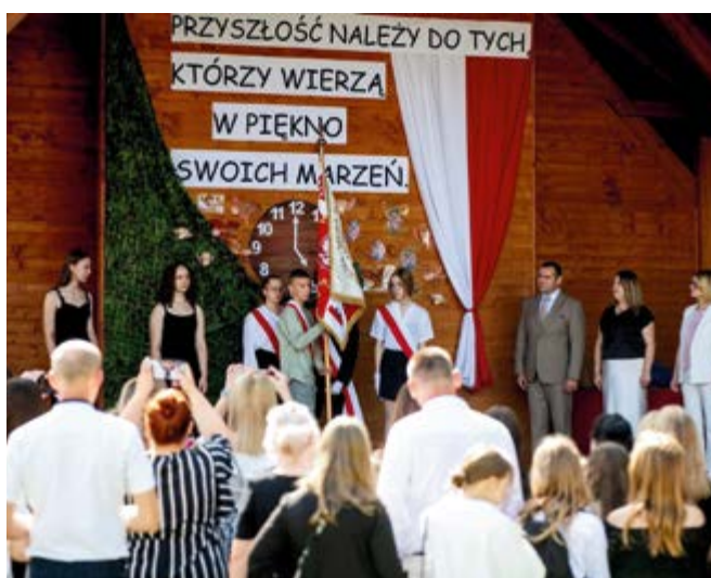
Zespół Placówek Integracyjnych w Kowali