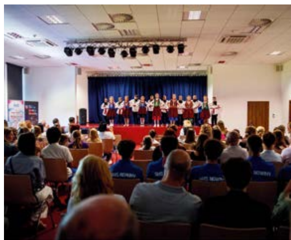
Występ "Małych Kowalan"