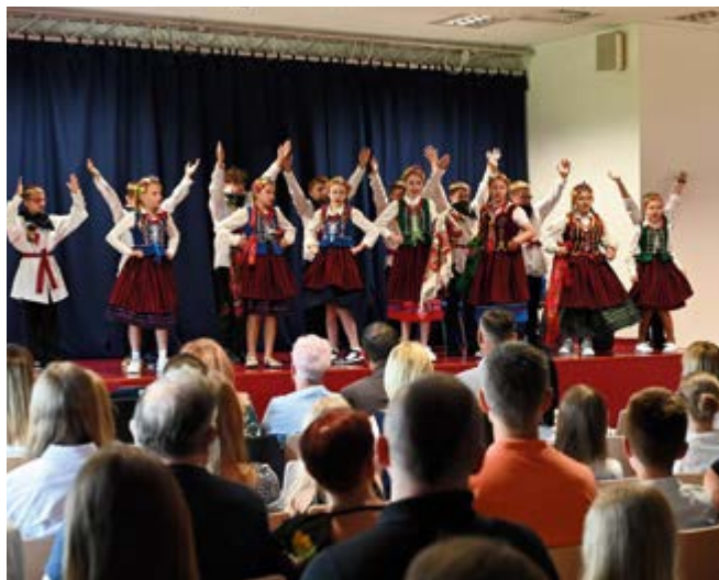
Występ "Małych Kowalan"