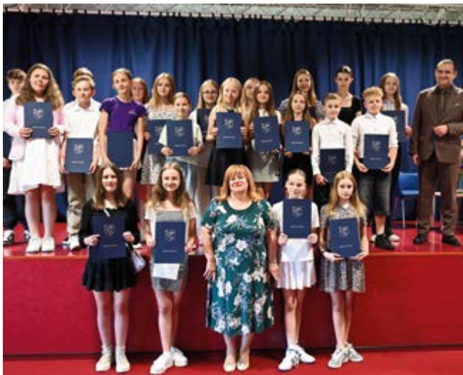
Pamiątkowe zdjęcie SP w Nowinach