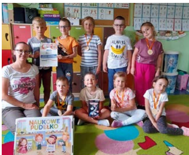
Program "Mali Wielcy Odkrywcy" w Bolechowicach

Nasza grupa znalazła się wśród szczęśliwców, którzy otrzymali pakiety naukowe, będące niewątpliwie dużą pomocą podczas realizacji zadań, a także organizatorzy programu docenili naszą aktywność i otrzymaliśmy przesyłkę z dyplomami i pamiątkowymi medalami dla wszystkich uczestników oraz Smart Mikroskopem dzięki któremu nasze zajęcia badawcze będą jeszcze ciekawsze.