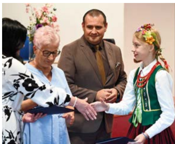
Uroczystość wręczenia stypendiów naukowych i sportowych

Głos Nowin miesięcznik nakład: 2700 egz.