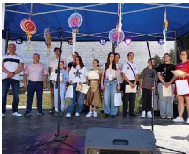
Rozstrzygnięcie Konkursu na logo dla MRGN

Młodzieżowa Rada Gminy ma swój logotyp i buduje własną komunikację wizualną.