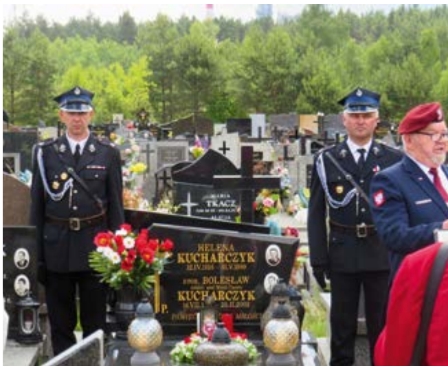
Warta Strażaków Ochotników przy grobie Bohaterów spod Monte Cassino