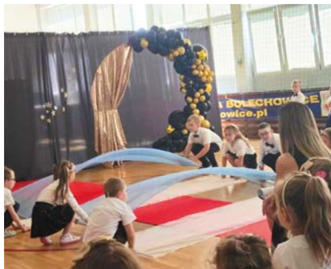
Przedszkole w Bolechowicach