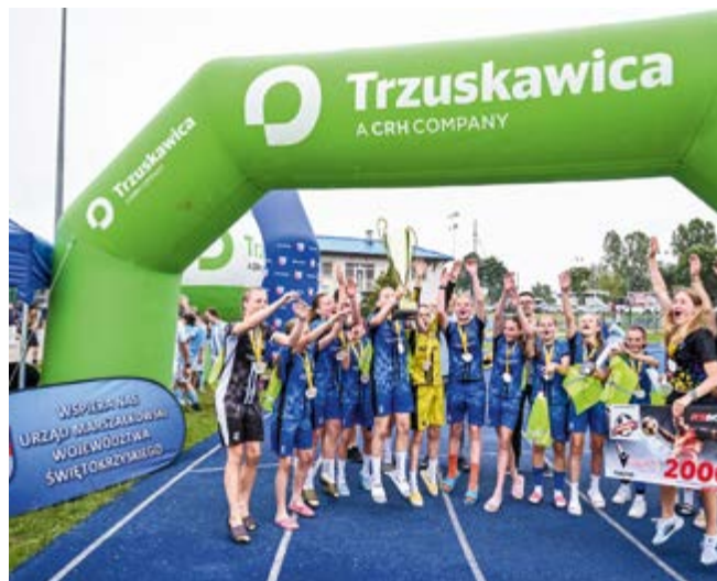
Zwycięczynie: piłkarki Tęczy Bydgoszcz