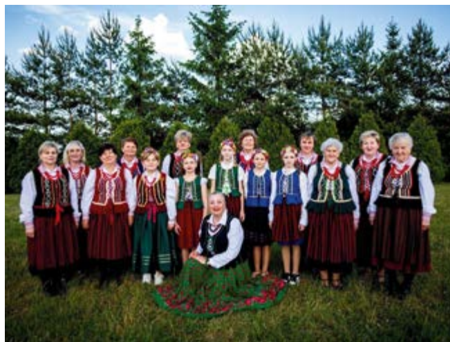
"Mali Kowalanie" i Zespół obrzędowy KGW "Kowalanki"