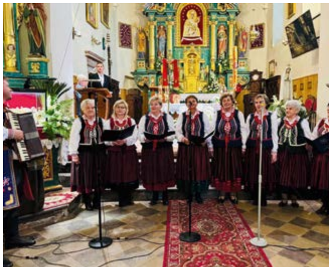
Zespół KGW Kowalanki