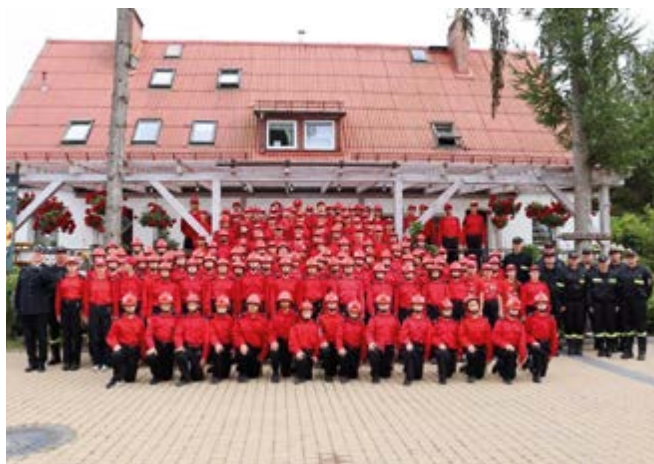
Obóz szkoleniowy Młodzieżowych Drużyn Pożarniczych

W sierpniu odbył się obóz szkoleniowy Młodzieżowych Drużyn Pożarniczych powiatu kieleckiego w Ośrodku Wypoczynkowym „Na wydmach” w m. Wicie koło Jarosławca. Wśród Młodzieżowych Drużyn Pożarniczych z terenu gminy Nowiny wzięło udział 10 członków MDP z OSP Kowala, OSP Wola Murowana i OSP Szewce. Organizatorem obozu była Ochotnicza Straż Pożarna w Ćmińsku i wzięło w nim udział 140 uczestników z powiatu kieleckiego oraz 10 wychowawców instruktorów, szkoląc się w technice rozwijania węży, łączności, podstaw pierwszej pomocy, podstaw musztry, węzłów, czy szeroko pojętych zasad służby pożarniczej. Młodzież miała możliwość wyjechać dzięki dofinansowaniu Komendy Głównej Państwowej Straży Pożarnej, Samorządu Gminy Nowiny oraz rodziców.