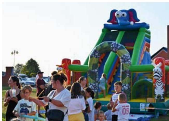
Strefa dziecięcej zabawy

Dzieci bawiły się na dmuchańcach, uczestniczyły w zabawach, grach i animacjach prowadzonych przez Lokalne Centrum Wolontariatu w Nowinach oraz Młodzieżową Radę Gminy Nowiny. Dużym zainteresowaniem cieszyła się także kapsuła kino sferyczne 5d promowana przez Regionalną Organizację Turystyczną Województwa Świętokrzyskiego, a także symulator lotu.