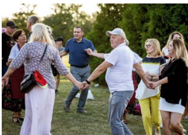
Zabawa i tańce jak za dawnych lat w Kowali