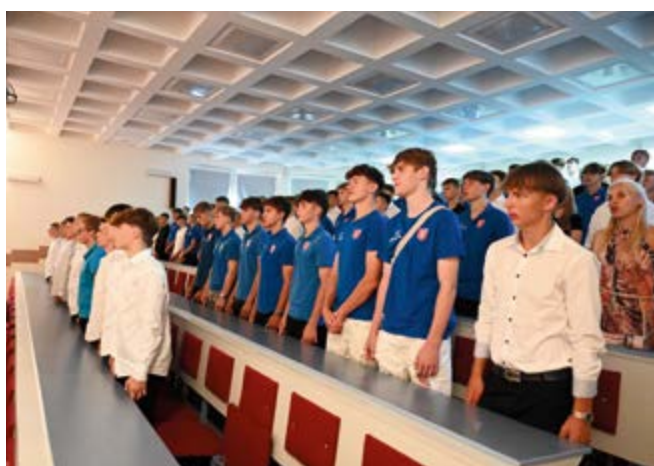
ZSP w Nowinach