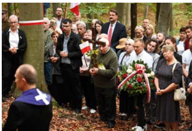
Modlitwa na Dołach Śmierci w lesie zgórskim