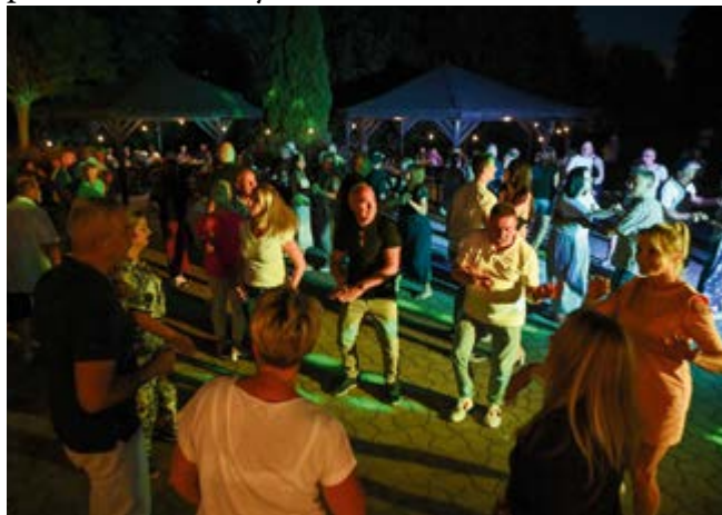
Wspólna zabawa taneczna