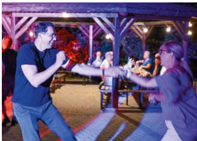
Mieszkańcy sołectwa bawili się wspaniale