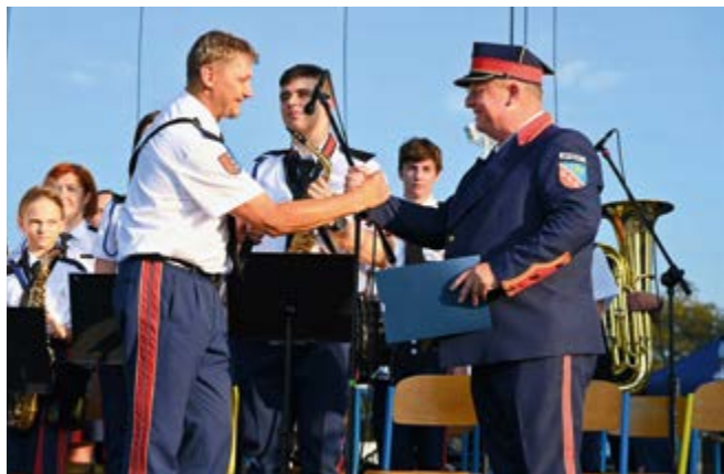
Między nami kapelmistrzami

Świętowanie 20-lecia działalności Orkiestry Dętej Nowiny 30 sierpnia zapisało się złotymi nutami w historii naszej społeczności. Tłumy mieszkańców i gości przybyły, aby wspólnie celebrować ten niezwykły jubileusz, pełen muzyki, wzruszeń i radości. Każdy zespół, który pojawił się na scenie, dostarczył publiczności niezapomnianych przeżyć muzycznych, prezentując swoje umiejętności na najwyższym poziomie.