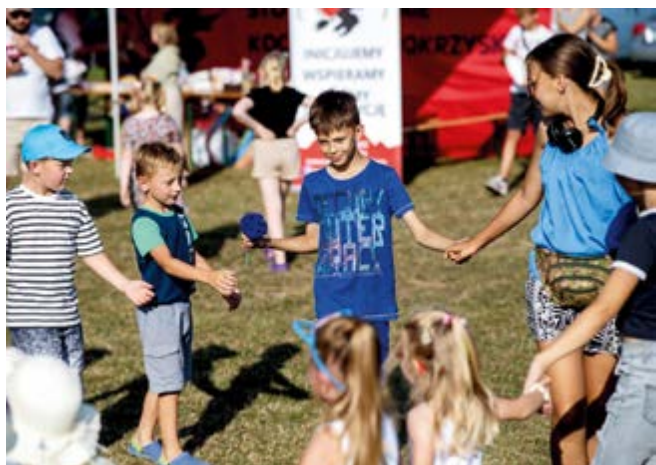
Zabawa dziecięca podczas pikniku