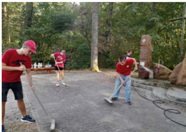
Porządkowanie terenu wokół pomnika w Szewcach

Organizacja Mistrzostw na trwale wpisała się w kalendarz sportów wodnych, których tradycją jest sprawdzenie przygotowania ratowników do skutecznego ratowania życia ludzkiego. Mistrzostwa są również okazją do pokazania, że wymiana doświadczeń, a także popularyzacja ratownictwa wodnego oraz ochrony ludności przed skutkami powodzi i innymi zagrożeniami wśród społeczeństwa województwa świętokrzyskiego, jest ważnym przedsięwzięciem w tworzeniu systemu bezpieczeństwa naszego kraju. Druhowie z OSP Kowala przystąpili do 6 konkurencji, w których pokazali duże doświadczenie w wodnych zmaganiach. W zawodach brało udział 64 drużyn, dzięki treningom i umiejętnościom druhowie z OSP Kowala uplasowali się na 9 miejscu w klasyfikacji ogólnej i 2 miejscu spośród Ochotniczych Straży Pożarnych. Serdecznie gratulujemy znakomitego wyniku i życzymy dalszych sukcesów.