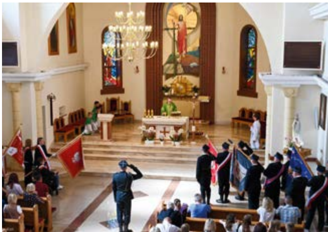
Uroczysta Msza Święta w Kościele w Nowinach

1 września w Kościele Parafialnym w Nowinach odbyła się uroczysta Msza Święta ku pamięci 85. rocznicy wybuchu II wojny światowej oraz z okazji rozpoczęcia nowego roku szkolnego.