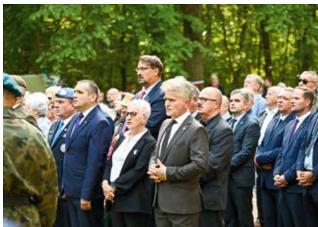
Uczestnicy uroczystości odsłonięcia pomnika