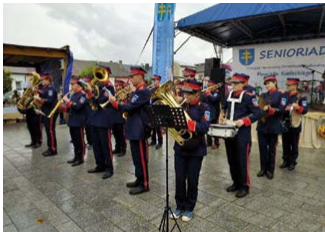
Orkiestra Dęta Nowiny

Nie zabrakło muzycznych akcentów. Specjalnie dla seniorów wystąpili: Zespół Rakowskie Fijołec-