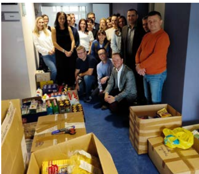
Zbiórka dla powodzian

Drodzy mieszkańcy gminy Nowiny, cały czas prowadzimy zbiórkę na rzecz osób poszkodowanych w wyniku powodzi. Do 19 września były przekazywane niezbędne produkty do punktu zbiórki w GOK „Perła” Nowiny. Zebraliśmy następujące dary: środki czystości, środki higieny osobistej ręczniki, pasty, szczoteczki do zębów, żele pod prysznic, szampony, dezodoranty, bieliznę osobistą, odzież, wodę pitną, żywność długoterminową.