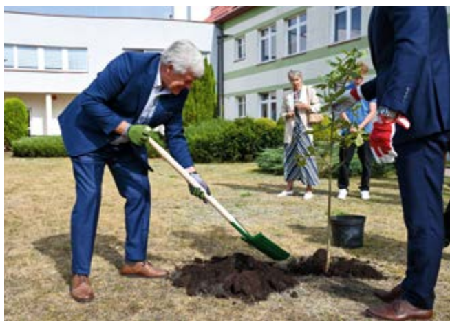
Włodzimierz Lubański zasadził pamiątkowe drzewo na terenie szkoły

Społeczność szkolna i gminna 13 września miała zaszczyt świętować 5-lecie istnienia Liceum Ogólnokształcącego Mistrzostwa Sportowego im. Włodzimierza Leonarda Lubańskiego w Nowinach. Uroczystości rozpoczęły się mszą świętą w intencji szkoły, a następnie miała miejsce oficjalna gala w liceum. Gościem honorowym wydarzenia był sam patron szkoły, legenda polskiej piłki nożnej – Włodzimierz Lubański. Mogliśmy usłyszeć fascynujące wspomnienia z jego kariery, m.in.: o jego rywalizacji podczas mistrzostw, co z pewnością zainspirowało młodzież. - Mam nadzieję, że wśród uczniów tej szkoły znajdą się moi następcy - powiedział z dumą Włodzimierz Lubański. Oprawę muzyczną sprawowała Orkiestra Dęta Nowiny, a maturzyści zachwycili publiczność pokazem swoich umiejętności tanecznych i piłkarskich.