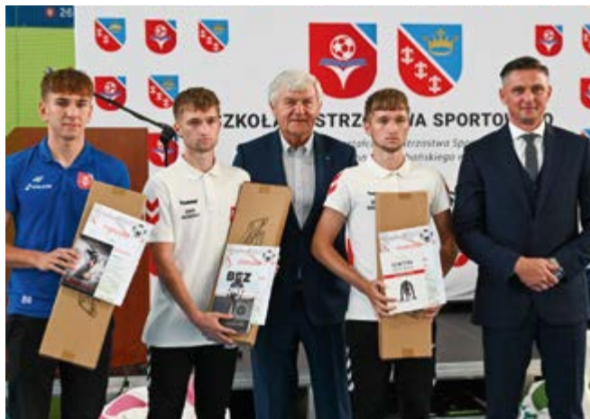
Jubileusz Liceum Sportowego w Nowinach