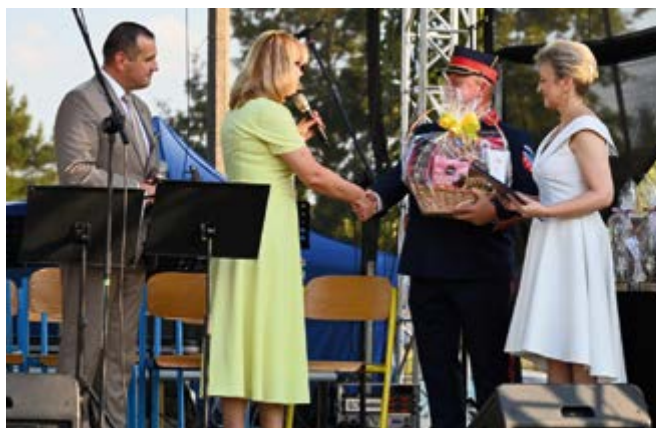
Życzenia od dyrekcji WDK Kielce

Koncerty przeplatane były podziękowaniami, gratulacjami oraz wręczeniem nagród dla zasłużonych mieszkańców, którzy od lat wspierają Orkiestrę. Na scenie zagościli: Młodzieżowa Orkiestra Dęta w Płotach, Szkolno-Gminna Orkiestra Dęta w Morawicy, Młodzieżowa Orkiestra Dęta OSP Bodzentyn, Orkiestra Dęta Daleszyce i Jubilatka - Orkiestra Dęta Nowiny. Na finał wszystkie Orkiestry zagrały wspólnie jeden z utworów.