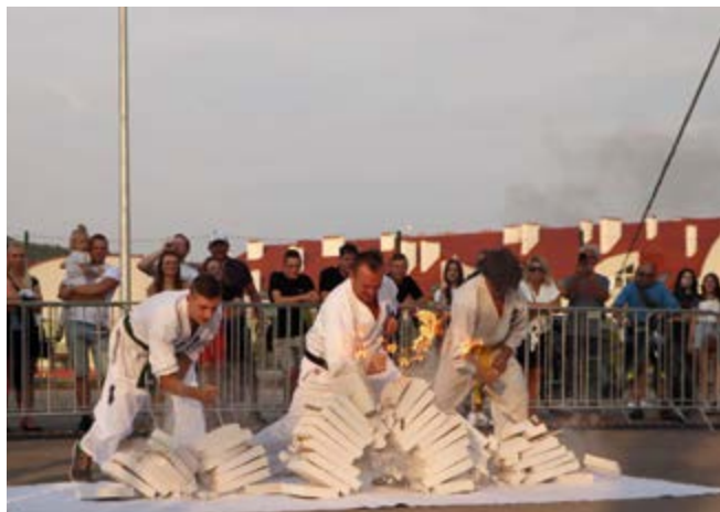
Pokaz karate klubu "Chikara"

Na uroczystość przybył także senator Krzysztof Słoń, który w swoim wystąpieniu życzył wszystkim mieszkańcom udanej zabawy, podkreślając, jak ważne są takie wspólne chwile dla budowania lokalnej wspólnoty.