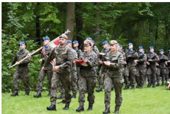
Wojska Obrony Terytorialnej