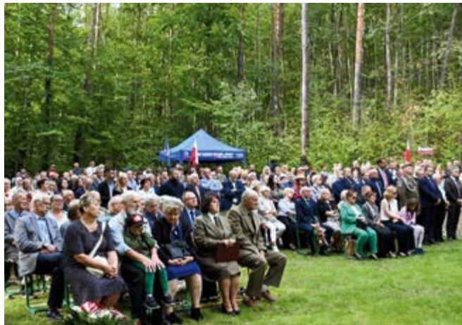
Uczestnicy uroczystości odsłonięcia pomnika