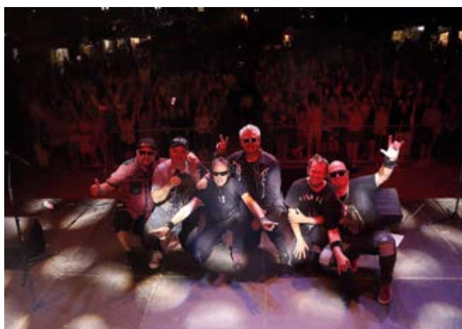
Zespół "Big Cyc"

Wisienką na torcie był koncert legendarnego zespołu „Big Cyc”! Usłyszeliśmy największe hity, które porwały tłumy do tańca i śpiewu. Energia, która płynęła ze sceny, była nie do opisania! Zespół zagrał swoje najbardziej znane utwory, takie jak „Makumba”, który zawsze rozgrzewa publiczność, „Rudy się żeni”, który wywołał uśmiechy na twarzach, oraz „Świat według Kiepskich”, który przywołał wspomnienia i bawił do łez. Nie zabrakło też energicznych kawałków jak „Berlin Zachodni” oraz satyrycznego „Wielka Miłość do Babci Klozetowej”, które podkręciły atmosferę do maksimum. Publiczność nie chciała pozwolić zespołowi zejść ze sceny, domagając się bisów, na które „Big Cyc” oczywiście odpowiedział z radością. To była prawdziwa eksplozja rockowej energii, którą na długo zapamiętamy!