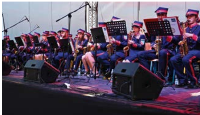
Orkiestra Dęta Nowiny