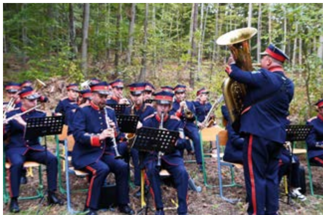
Oprawę Mszy Św. sprawowała Orkiestra Dęta Nowiny