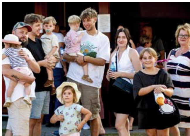
Mieszkańcy całymi rodzinami uczestniczyli w pikniku