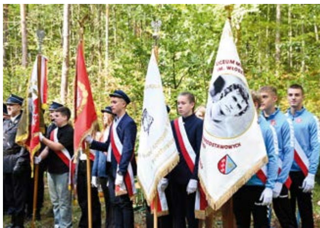
Poczty sztandarowe szkół i straży pożarnych

Ceremonia rozpoczęła się od przybycia pocztów sztandarowych, które nadały wydarzeniu podniosły