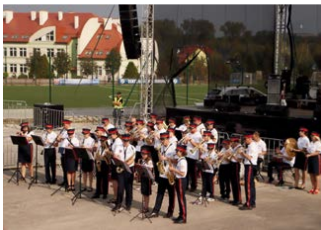
Orkiestra Dęta Nowiny

obecny mógł podziwiać ich wspaniałe umiejętności muzyczne i taneczne. To był prawdziwy pokaz talentu! W repertuarze znalazły się prawdziwe muzyczne hity, które rozgrzały publiczność! Usłyszeliśmy m.in.: energetyczne „Hey Brother” Avicii, kultowe kawałki Michaela Jacksona, które wprowadziły wszystkich w taneczny nastrój, oraz dynamiczne „Bella Ciao”, które wywołało burzę oklasków. Te nowoczesne aranżacje pokazały, jak wszechstronne i kreatywne mogą być orkiestry lokalnych społeczności, dostarczając wszystkim niesamowitych wrażeń muzycznych.