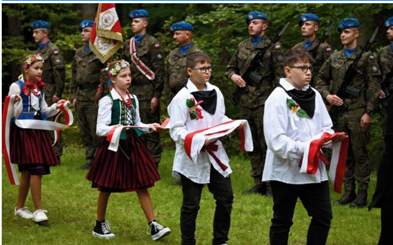
Uczniowie SP w Kowali przekazują szarfy pamięci rodzinom zamordowanych żołnierzy

15 września w Zgórsku odbyła się uroczystość odsłonięcia i poświęcenia pomnika upamiętniającego ofiary zamordowane przez komunistów w lasach zgórskich. Wydarzenie, zorganizowane pod Patronatem Honorowym Prezydenta RP Andrzeja Dudy, zgromadziło licznych uczestników, w tym mieszkańców, przedstawicieli władz lokalnych oraz rodziny ofiar.