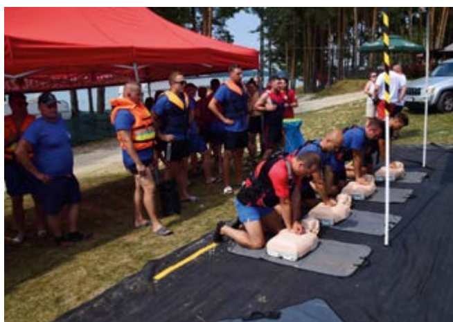
XXII Mistrzostwach Województwa Świętokrzyskiego Grup Szybkiego Reagowania na Wodzie

31 sierpnia Druhowie z OSP Kowala brali udział w XXII Mistrzostwach Województwa Świętokrzyskiego Grup Szybkiego Reagowania na Wodzie na terenie zalewu w Chańcy.