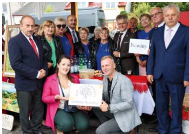
Klub Seniora "Seniorita" reprezentował gminę Nowiny w Rakowie

Tegoroczny Przegląd Senioralnej Działalności Kulturalnej Powiatu Kieleckiego odbył się 14 września w Rakowie. Wspaniałe występy artystyczne, prezentacja rękodzieła i oczywiście wspólna zabawa i integracja zdominowały „Senioriadę”, w której aktywny udział wziął Klub Seniora „Seniorita” z Nowin.