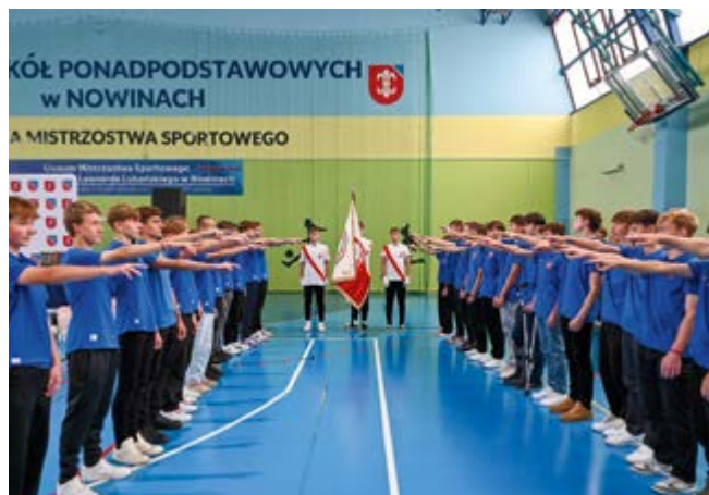
Ślubowanie klas pierwszych