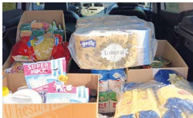
Dary dla powodzian

Radnymi Rady Gminy Nowiny, Gminnym Ośrodkiem Pomocy Społecznej w Nowinach, Centrum Usług Wspólnych w Nowinach oraz Zakładem Gospodarki Komunalnej i Mieszkaniowej w Nowinach.