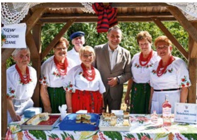
Zespół ludowy "Bolechowiczanie"