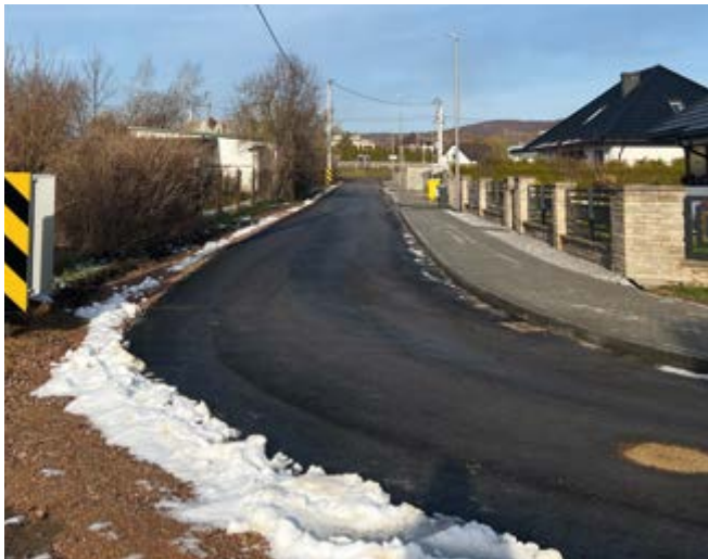
Droga na dz. 476.4 w m. Zgórsko

W ramach zadania wykonano przebudowę drogi na odcinku ok. 140,00m, wraz nawierzchnią asfaltową jezdni, chodnikiem z kostki betonowej, wjazdami na posesję oraz elementami odprowadzenia wód opadowych.