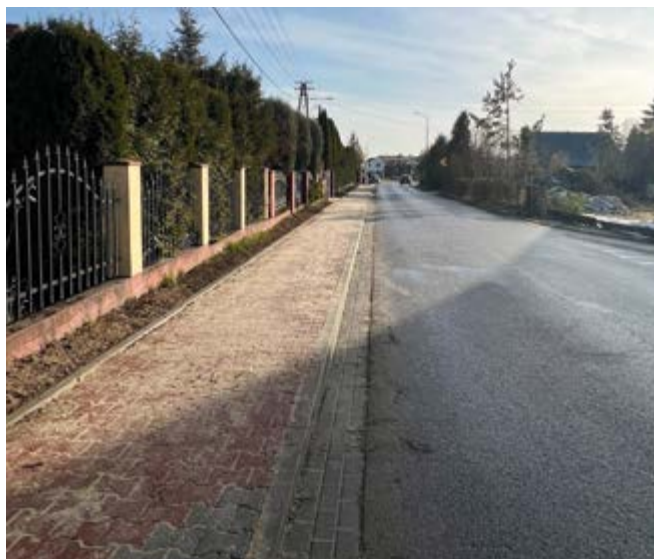
ul. Słoneczna w m. Zgórsko

W ramach zadania wykonano remont nawierzchni asfaltowej jezdni ul. Rajskiej na odcinku długości ok. 200,00 m, od skrzyżowania z ul. Piaskową do granicy gminy przed ciekim Bobrzyczką, wraz z utwardzeniem poboczy tłuczniem kamiennym.