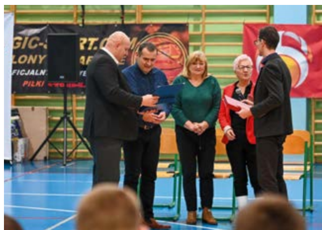
Organizatorzy i patroni turnieju