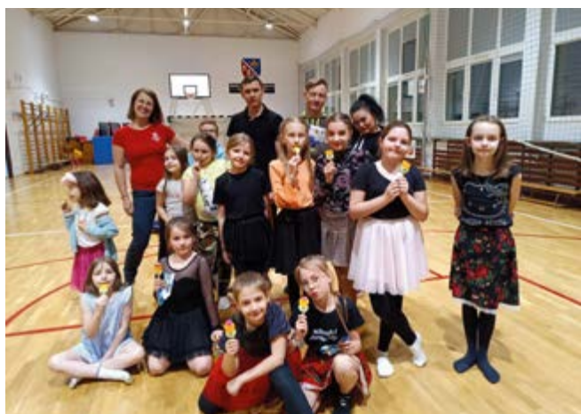
Warsztaty tematyczne realizowane w ramach projektu

34 godzin zumba fitness w stylu folk, 34 zajęć tanecznych dla dzieci, 45 godzin warsztatów kreatywnych, 2 rodzinne wyjazdy koncertowe, zaangażowanie wolontariuszy i 182 uczestników projektu – tak w liczbach można podsumować projekt „Rodzina w stylu folk”, który właśnie dobiega końca. Projekt od czerwca ubiegłego roku był realizowany przez Stowarzyszenie „Siła Woli”.