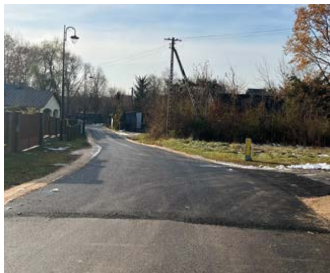
ul. Markowizna w m. Słowik

Remont nawierzchni asfaltowej jezdni drogi gminnej na dz. nr ew. 223/2 w m. Zgórsko