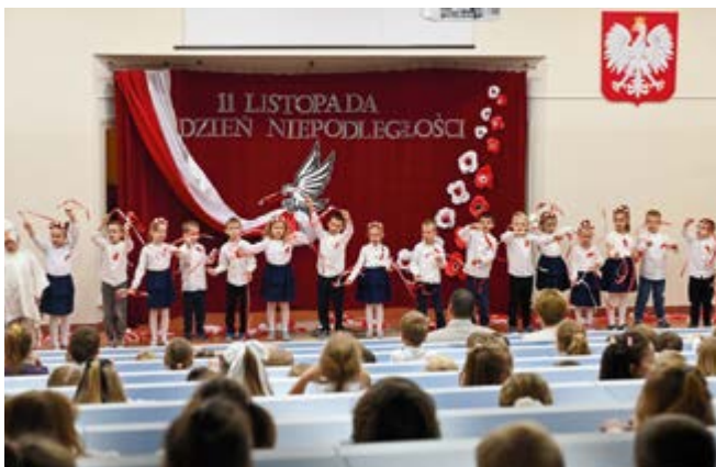
Przedstawienie z okazji Święta Niepodległości w wykonaniu przedszkolaków

Dziękujemy wszystkim, którzy przyczynili się do organizacji tego pięknego wydarzenia, wprowadzającego dzieci w patriotyczny nastrój i pozwalającego im lepiej zrozumieć, dlaczego 11 listopada jest tak ważnym dniem w naszej historii.