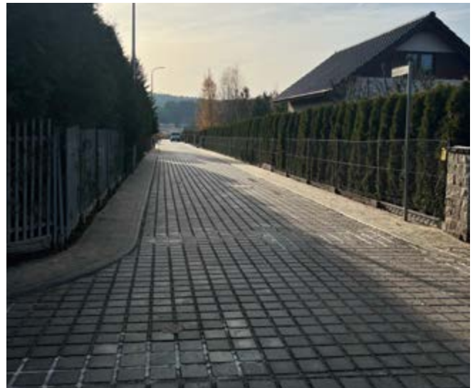
ul. Żwirowa w m. Szewce

z kostki betonowej, wjazdami na posesję, elementami odprowadzenia wód opadowych, oraz budowę oświetlenia ulicznego.