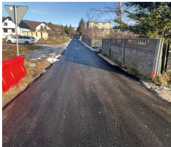
Droga na dz. 223.2 w m. Zgórsko

W ramach zadania wykonano remont nawierzchni asfaltowej jezdni drogi gminnej, ul. Markowizna na odcinku długości ok. 90,00 m, wraz z utwardzeniem poboczy tłuczniem kamiennym.