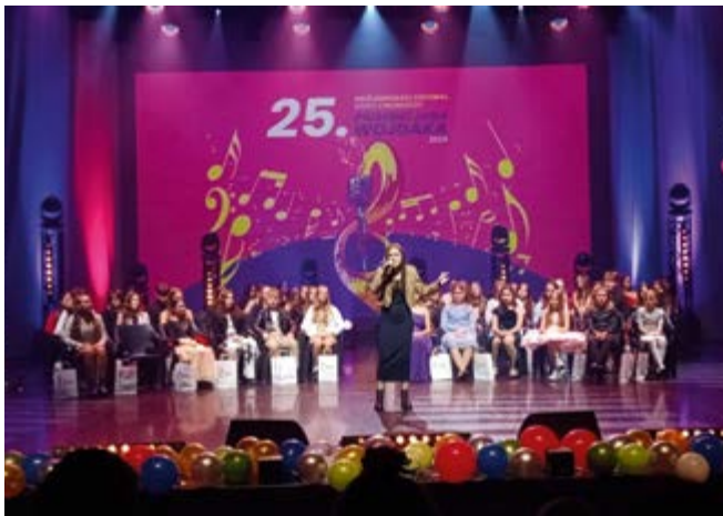
25. Ogólnopolski Festiwal Dzieci i Młodzieży „Piosenki Jana Wojdaka”