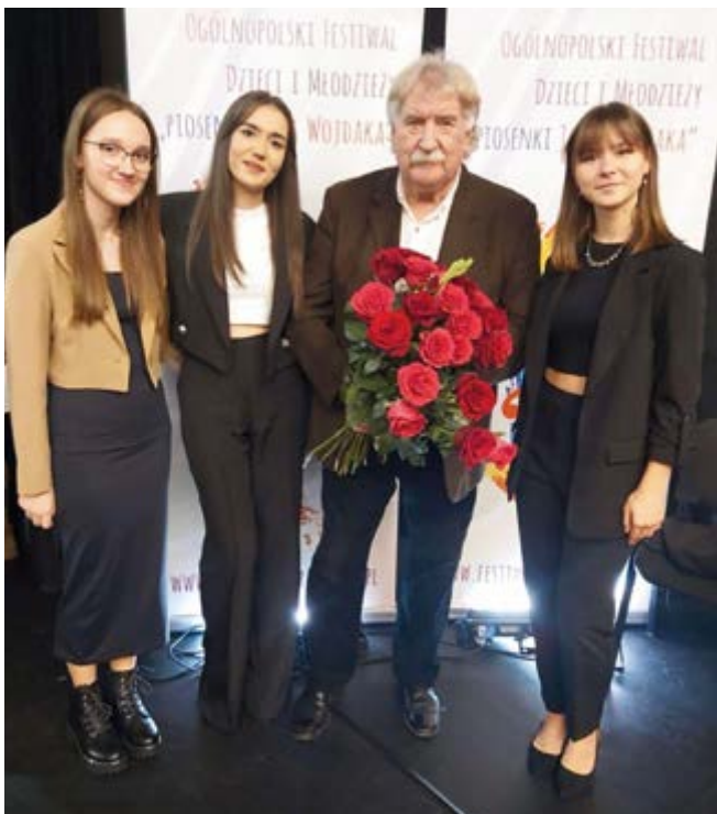
Nagrodzone solistki z patronem festiwalu Janem Wojdakiem