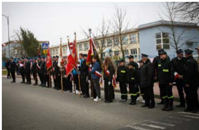
Uroczystości patriotyczne w Nowinach

11 listopada mieszkańcy gminy Nowiny zgromadzili się, by wspólnie uczcić Święto Niepodległości, upamiętniające odzyskanie przez Polskę niepodległości w 1918 roku. To ważny dzień w historii naszego narodu – symbol walki o wolność, jedności oraz dumy z polskiego dziedzictwa. Każdego roku 11 listopada staje się okazją do wyrażenia naszej wdzięczności za wolność oraz pamięci o przodkach, którzy o nią walczyli.