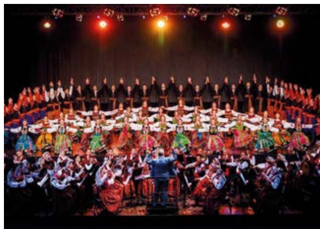
Koncert Zespołu "Mazowsze"

W projekcie była także przestrzeń do działania dla wolontariuszy: w 3 szkoleniach przeszkolono łącznie 61 kandydatów na wolontariuszy. W ramach projektu ze stowarzyszeniem na stałe współpracowało 10 wolontariuszy wspierając organizację i przebieg warsztatów dla najmłodszych uczestników.