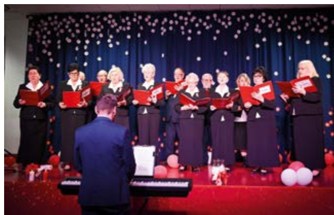
Występ Chóru „Nowina”

Orkiestra Dęta Nowiny oraz Chór „Nowina” zaprezentowali repertuar, który poruszył serca wszystkich obecnych.