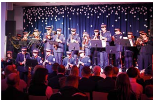
Koncert Orkiestry Dętej Nowiny