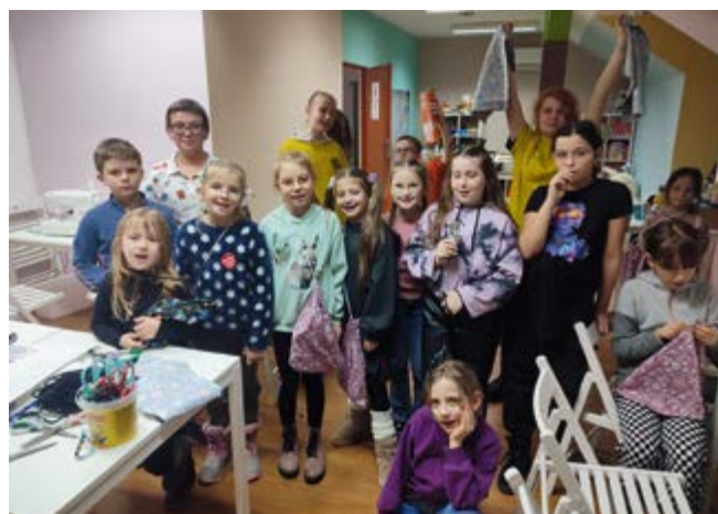
Warsztaty tematyczne realizowane w ramach projektu

Podczas pikniku odbyły się także warsztaty taneczne tańców narodowych oraz konkurs z nagrodami na najlepszego tancerza amatora.