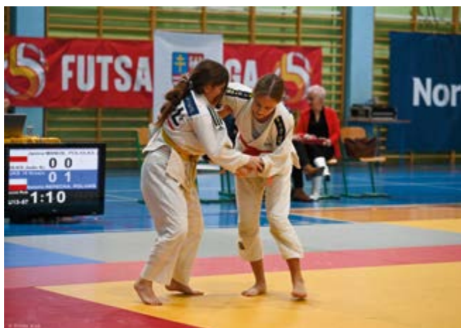
Uczestniczki turnieju judo

Dziękujemy wszystkim zawodnikom za emocjonujące walki, pełne zaangażowania i sportowej pasji. Gratulujemy zwycięzcom oraz wszystkim uczestnikom – jesteście inspiracją dla naszej społeczności!