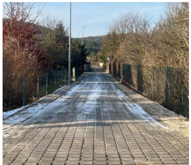
ul. Piaskowa w m. Szewce