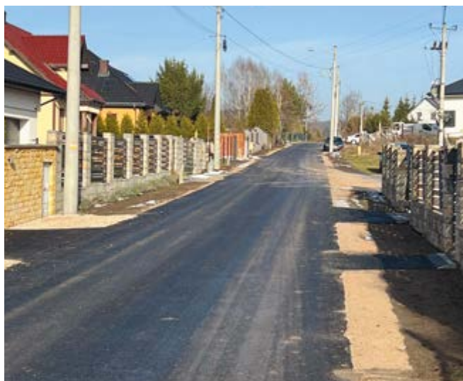
ul. Rajska w m. Szewce