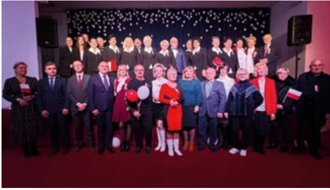
Uczestnicy Koncertu Patriotycznego w GOK "Perła"

pomniane wrażenia muzyczne. Na długo zapadnie w pamięć mieszkańców ekspresyjnie zaprezentowany utwór „Żeby Polska była Polską”. Dla najmłodszych Lokalne Centrum Wolontariatu przygotowało strefę warsztatów patriotycznych. Dziękujemy pocztom sztandarowym szkół, wszystkim jednostkom OSP z terenu naszej gminy, Radnym Rady Gminy Nowiny oraz mieszkańcom za obecność i wspólne świętowanie tego wyjątkowego dnia!