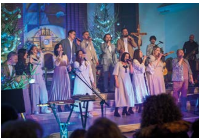
Jeden z najpopularniejszych w kraju zespołów muzyki chrześcijańskiej dał niezapomniany występ w kościele w Nowinach

Parafia w Nowinach stała się miejscem wyjątkowego wydarzenia muzycznego - koncertu "Kolędy Świata" w wykonaniu zespołu TGD (Trzecia Godzina Dnia). Wydarzenie przyciągnęło tłumy mieszkańców, którzy wypełnili świątynię po brzegi. Koncert odbył się w przestronnym kościele, który dzięki swojej halowej architekturze oraz profesjonalnemu nagłośnieniu i oświetleniu zamienił się w doskonałą salę koncertową.