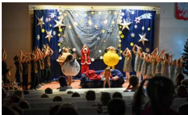
Jasełka przedszkolaków z Przedszkola Samorządowego im. Pluszowego Misia w Nowinach