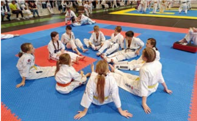
Zawodnicy Klubu „Chikara” podczas jednego z ogólnopolskich turniejów karate – siła, technika i determinacja na najwyższym poziomie

Rok 2024 był intensywnym i pełnym sukcesów okresem dla Klubu Karate Kyokushin „Chikara” z Nowin. Dzięki zaangażowaniu zawodników, trenerów oraz wsparciu gminy Nowiny klub nie tylko rozwijał umiejętności swoich członków, ale także odnosił znaczące sukcesy na arenach lokalnych, ogólnopolskich i międzynarodowych.