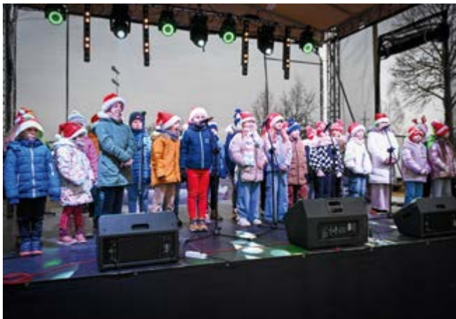
Na scenie tego dnia stanęło wielu wspaniałych artystów

Na jarmarku można było znaleźć wszystko, co kojarzy się z okresem bożonarodzeniowym. Piękne stroiki, aromatyczne miody, wyjątkowe sery, pachnące pierniki, a także oryginalne kosmetyki i tradycyjne wędliny cieszyły się ogromnym zainteresowaniem. Spotkania z lokalnymi twórcami stworzyły niepowtarzalną okazję do rozmów i wspierania rodzimej twórczości.