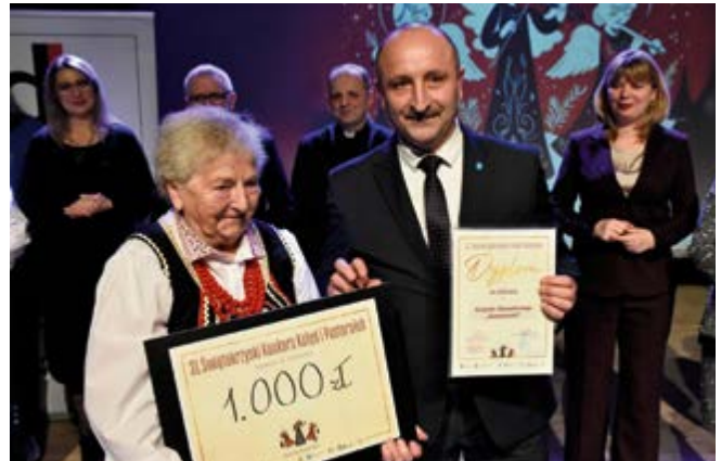
Zespół Obrzędowy „Kowalanki” po raz kolejny znalazł się w czołówce najlepszych artystów

Sukcesy naszych artystów nie ograniczyły się jednak do występów solistów. W kategorii zespołów ludowych trzecie miejsce ex aequo zdobył Zespół Obrzędowy „Kowalanki” z Kowali, który swoim barwnym występem i autentycznym wykonaniem tradycyjnych utworów podbił serca widzów oraz jury. Zespół otrzymał nagrodę pieniężną w wysokości 1000 zł.