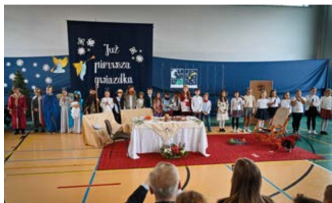
Jasełka w Szkole Podstawowej w Nowinach