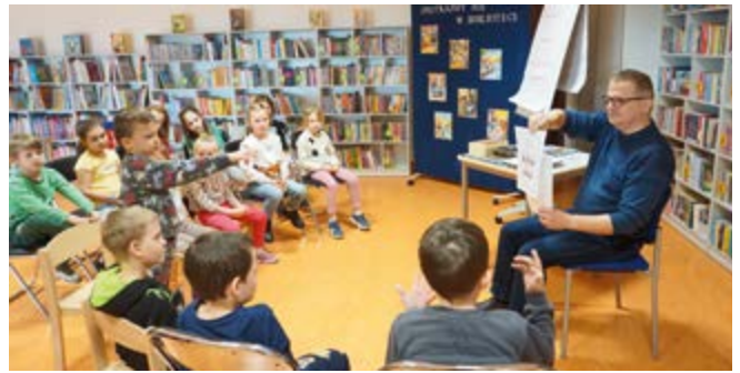
Młodzi czytelnicy aktywnie uczestniczą w zajęciach promujących czytelnictwo

W ciągu całego roku 2024 zorganizowaliśmy w Bibliotece 21 spotkań i warsztatów promujących czytelnictwo, w których w sumie uczestniczyło 426 osób. Na wyróżnienie zasługują warsztaty czerpania papieru i kaligrafii, które okazały się prawdziwym hitem. Gminna Biblioteka Publiczna w Nowinach