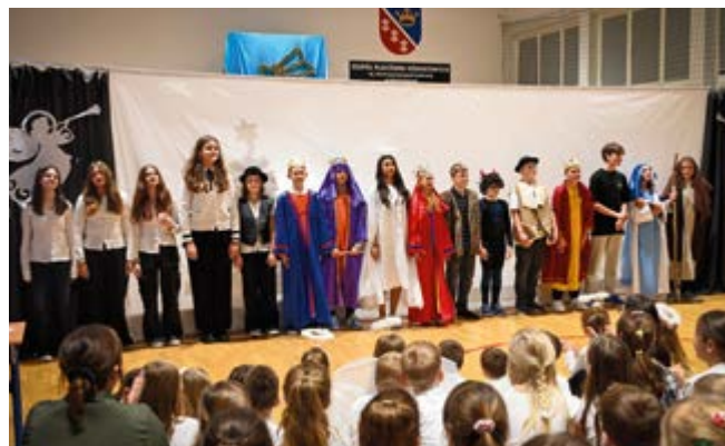
Jasełka w Szkole Podstawowej w Bolechowicach

Organizatorom, nauczycielom, rodzicom i przede wszystkim dzieciom należą się wielkie podziękowania za trud włożony w przygotowanie tych magicznych chwil.