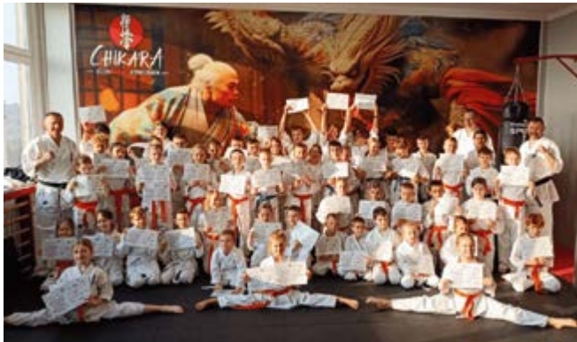
Zawodnicy „Chikary” tuż po egzaminie na stopnie uczniowskie. Chwila pełna emocji i satysfakcji z osiągniętych wyników

w Nowinach dzięki uprzejmości firmy Dyckerhoff Polska. Była to nie tylko okazja do promocji klubu, ale również inspirujący moment dla zawodników, by połączyć trening z pięknem natury.