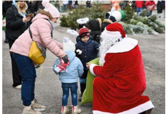
Podczas jarmarku było wiele atrakcji. Najmłodszych najbardziej cieszył Święty Mikołaj