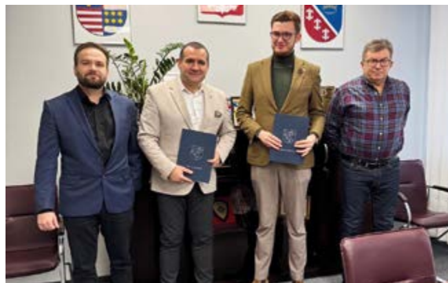
Zgodnie z podpisaną umową inwestycja ma być gotowa za trzynaście miesięcy

Koszt zakupu i montażu nowego ozonatora wynosi 378 tysięcy złotych, z czego również 90% zostanie pokryte z rządowego wsparcia. Prace, które obejmują demontaż starego urządzenia, wykonanie nowej instalacji oraz montaż nowego ozonatora, zrealizuje firma PROMinent Dozotechnika Sp. z o.o. z Mirkowa. Całość tego etapu zostanie ukończona w ciągu sześciu miesięcy.