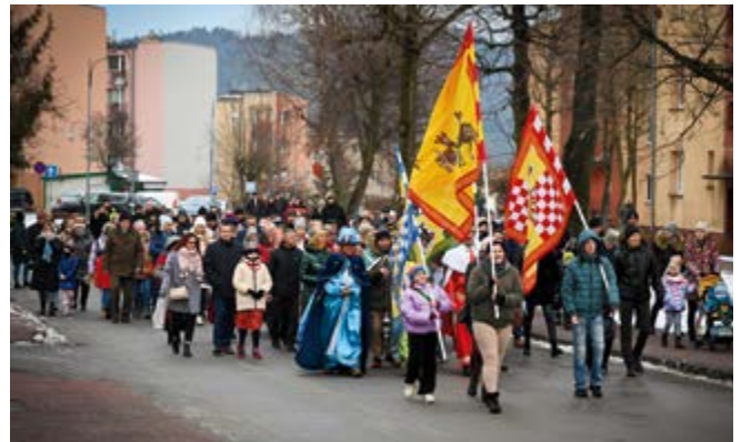
Ulice Nowin tętniły świąteczną atmosferą podczas tradycyjnego Orszaku Trzech Króli