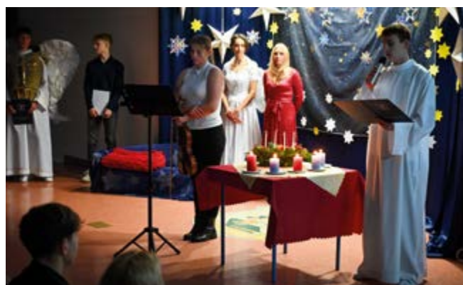
Jasełka Liceum Ogólnokształcącego Mistrzostwa Sportowego im. Włodzimierza Leonarda Lubańskiego