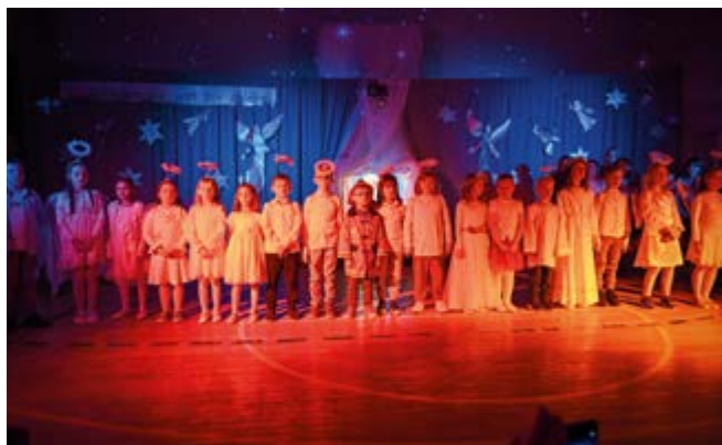
Jasełka w Zespole Placówek Integracyjnych w Kowali