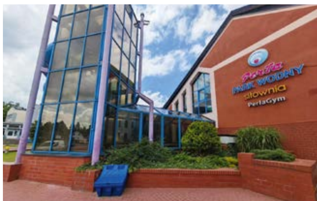
Wieża basenowa wraz z łącznikiem przejdą kompleksowy remont

Prace rozpoczną się od opracowania koncepcji i projektu budowlanego, a następnie wykonawca wystąpi o pozwolenie na budowę. Roboty budowlane ruszą za około siedem miesięcy i zakończą się w ciągu 13 miesięcy od dnia podpisania umowy. Zmodernizowana wieża zyska nowoczesny wygląd oraz zachwycające efekty świetlne, które stworzą wyjątkowy klimat dla użytkowników basenu.