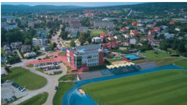
W ciągu roku do gminy na stałe przeprowadziło się 170 osób

Rok 2024 w gminie Nowiny przyniósł wiele zmian, które pokazują, jak dynamicznie rozwija się lokalna społeczność. Przybyło nowych mieszkańców, pojawiły się kolejne maluchy z popularnymi i niecodziennymi imionami, a Urząd Stanu Cywilnego miał pełne ręce pracy przy wydawaniu dokumentów i aktów stanu cywilnego, czy chociażby przy ślubach. Jakie wydarzenia i liczby zapisały się w gminnej historii w minionym roku? Sprawdźmy!